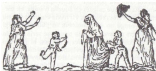
Els Sants Innocents. Vaillets que pengen la llufa.

El Krampus tirolès, els mercats de Nadal alemanys, les corals de Santa Llúcia escandinaves... el Nadal europeu és molt ric i ple de tradicions. Les voleu conèixer?