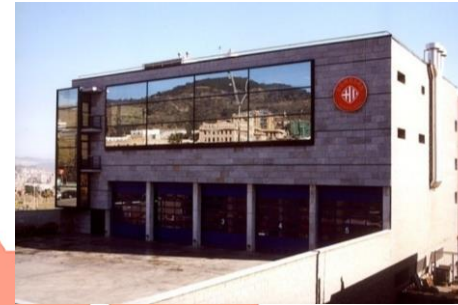
PARC VALL D'HEBRON