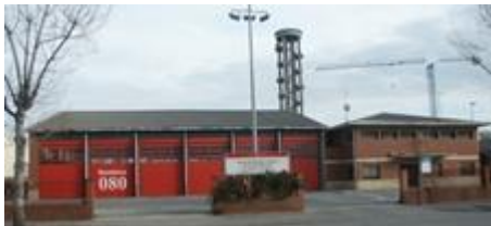
PARC ZONA FRANCA