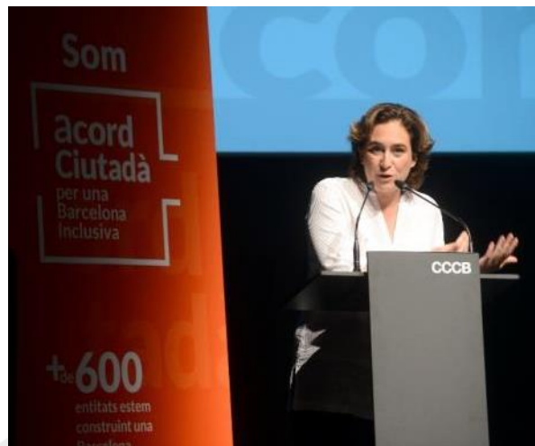
Ada Colau Alcaldeessa de Barcelona

Barcelona ha de ser, sobretot, un projecte col·lectiu no d'un govern, o d'un ajuntament, sinó que ha de ser una ciutat que tingui un projecte compartit pels veïns i veïnes i per tots els actors que hi intervenen.