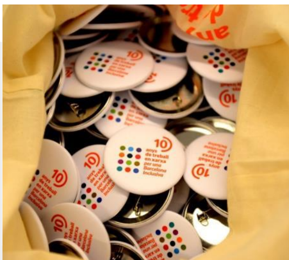
Valoració de la Jornada