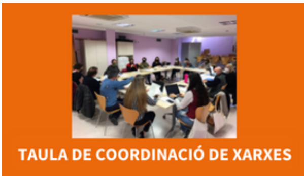
TAULA DE COORDINACIÓ DE XARXES