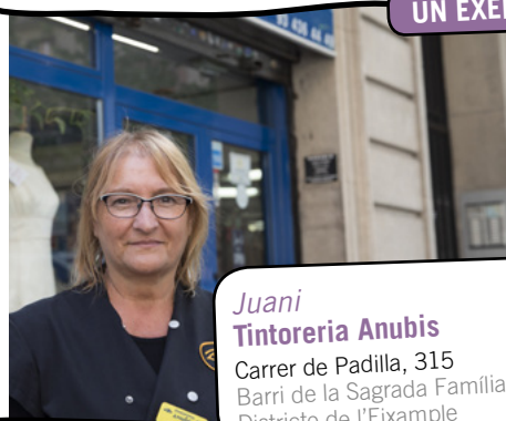
Juani Tintoreria Anubis Carrer de Padilla, 315 Barri de la Sagrada Família Districte de l'Eixample

L' Anubis és una tintoreria que fa servir productes i sistemes de neteja ecològics. També recull els subproductes i residus finals de les màquines de rentat i els diposita al punt verd perquè els tractin.