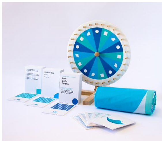
Ruleta i targetes