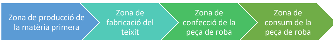
Gràfic 4. Etapes de la producció d'una peça de roba

La producció de la roba comprèn moltes etapes, cada una de les quals genera impacte en el medi ambient i les persones.