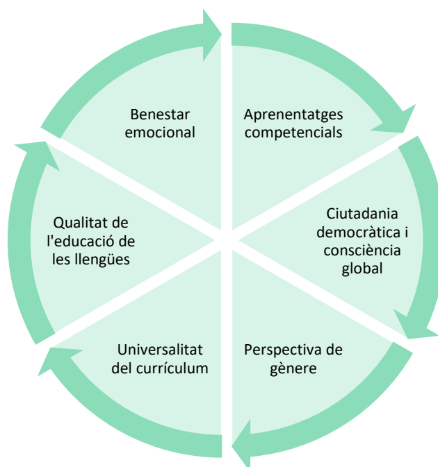
Figura 1. Els sis vectors del currículum educatiu actual

Així, doncs, en l'elaboració de la nostra fitxa didàctica tindrem en compte de manera transversal en totes les parts del projecte Renova Escolar els eixos vertebradors de la figura 1.