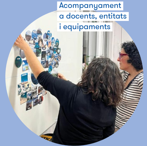
Acompanyament a docents, entitats i equipaments