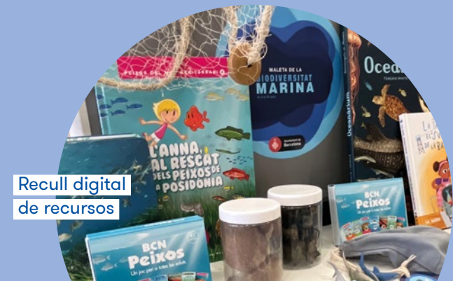
Recull digital de recursos