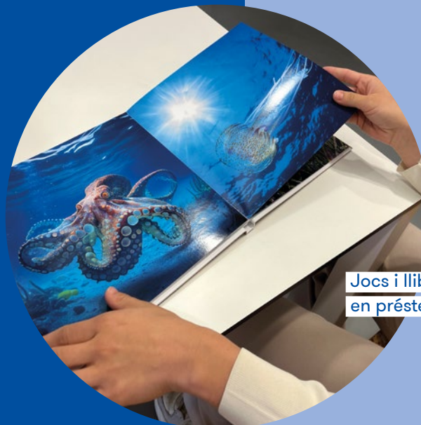
Jocs i llibres en préstec