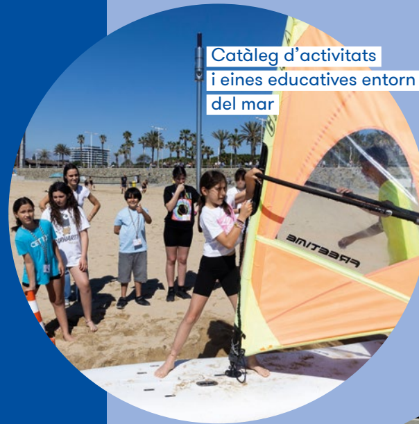
Catàleg d'activitats i eines educatives entorn del mar

Els equips de l'Oficina Litoral i de l'Oficina de Canvi Climàtic i Sostenibilitat col·laboren per ajudar-vos a incorporar amb el programa Escoles + Sostenibles l'educació sobre el medi marí als vostres centres educatius, abordant aquesta temàtica des de diverses perspectives.