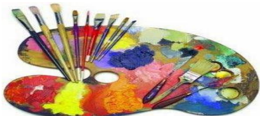
Dibujo y pintura

Destacan como valores del Casal de Barrio La Pau: la orientación a las personas y al barrio, la participación y el voluntariado, el trabajo en red, la cohesión social, la calidad y el respeto al medio ambiente.