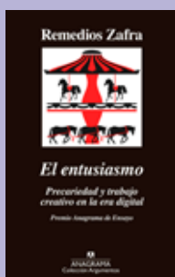
El entusiasmo Remedios Zafra Anagrama, 2017