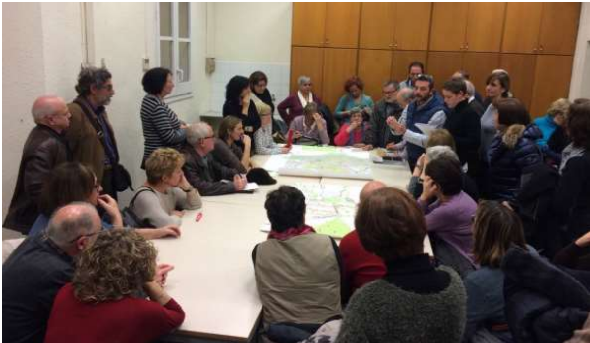
Grup de Treball de la sessió de NXB Horta (Nord).

Les diferents sessions s'han realitzat als equipaments de proximitat dels districtes, com ara centres cívics, biblioteques, casals de barri, casals de gent gran, seu del districte, etc. Han estat presidides pels representants institucionals, tant del Districte (regidor/a, conseller/a, tècnic/a), com de l'àmbit d'Ecologia Urbana i Mobilitat, i hi ha participat representants de TMB. Addicionalment, les sessions han estat conduïdes pel personal tècnic del Departament de Participació de la Direcció de Comunicació i Participació d'Ecologia Urbana, amb el suport d'URBANing, empresa encarregada de la dinamització de les sessions i elaboració de la documentació i material gràfic necessari.