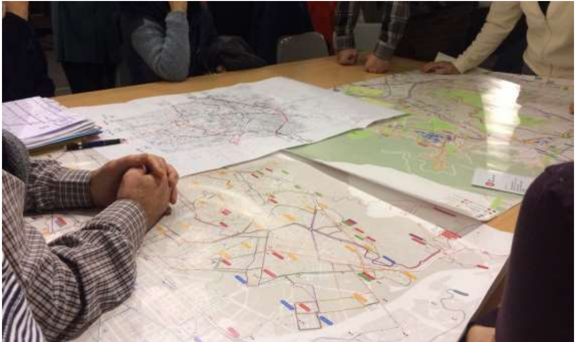
Grup de Treball de la sessió de NXB Horta.