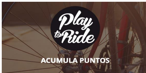
Barcelona City Challenge