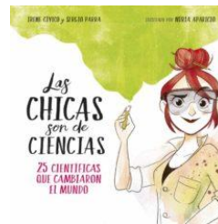
Las chicas son de ciencias: 75 científicas que cambiaron el mundo (ed. Montena)