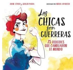
Las chicas son guerreras: 25 rebeldes que cambiaron el mundo (ed. Montena)