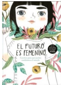
El futuro es femenino: cuentos para que juntas cambiemos el mundo (Nube de Tinta)