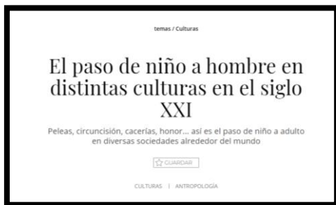
El paso de niño a hombre en distintas culturas en el siglo XXI