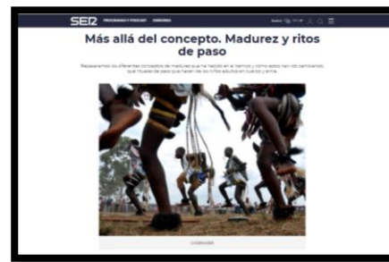
Más allá del concepto. Madurez y ritos de paso (Cadena SER)