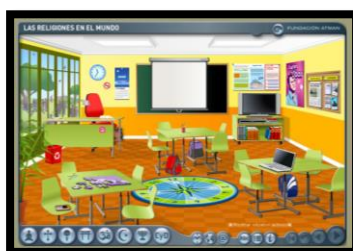
Las religiones en el mundo. (Instituto Nacional de Tecnologías Educativas y de Formación del Profesorado)