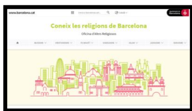
Coneix les religions de Barcelona (Oficina d'Afers Religiosos. Ajuntament de Barcelona)