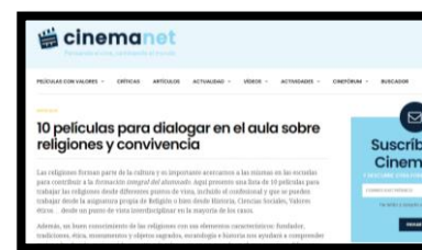
Deu pel·lícules per dialogar a l'aula sobre religions i convivència