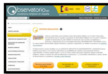
Observatorio del pluralismo religioso en España. Recursos didàctics