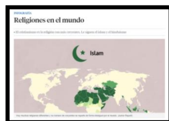
Infografies sobre les principals religions del món (La Vanguardia)