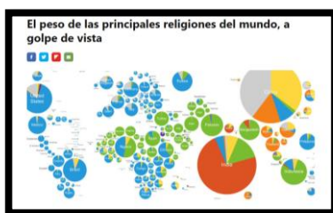
El pes de les principals religions del món a cop d'ull