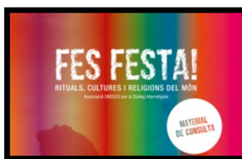
Fes festa! Rituals, cultures i religions del món. Material per a l'alumnat i el professorat (AUDIR)