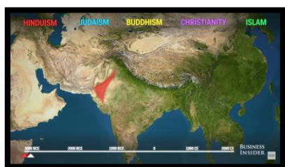
Mapa animat de l'expansió de les religions al voltant del món

(Cliqueu damunt les imatges per accedir al recurs)