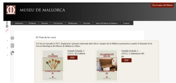
Museu de Mallorca