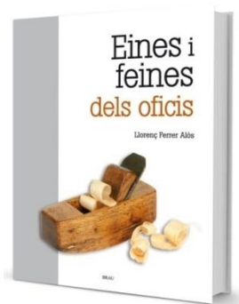
Eines i feines dels oficis