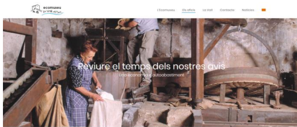
Ecomuseu Vall d'Ora