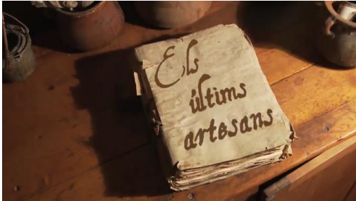
Els últims artesans (TV3)