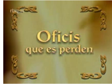
Oficis que es perden (RTVE)