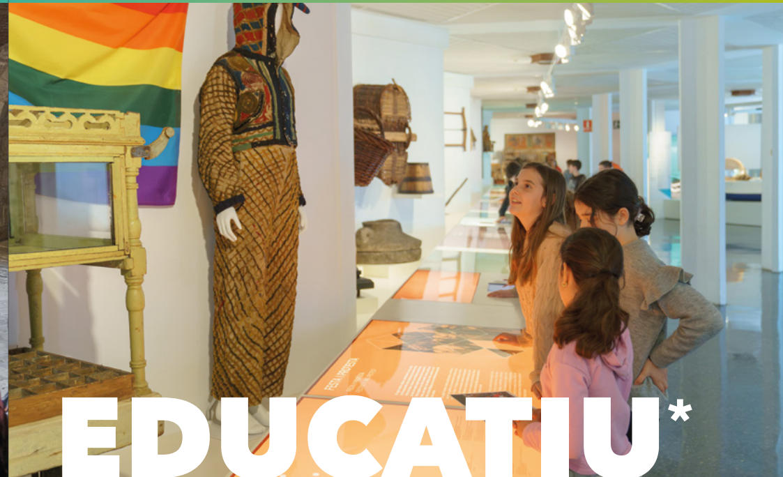
Seu Parc Montjuïc

La Seu Parc Montjuïc recull estris i eines procedents de la vida quotidiana, majoritàriament de la Catalunya de mitjan segle XX. Són objectes vinculats a la cultura popular, la vida rural i els oficis preindustrials, com ara la pesca, l'agricultura, la ramaderia i el tèxtil.