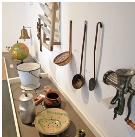
Ac activitat participativa

Una activitat per experimentar, viure, reconèixer i també reflexionar sobre els objectes comuns que envolten la nostra vida quotidiana i els que envoltaven els nostres avantpassats. Els relacionarem amb objectes d'altres llocs del món que es deixen tocar, olorar, escoltar o sentir. Compartirem records i vivències del passat del dia a dia, del domèstic, dels mons del treball o del festiu. Viurem la cultura que ens és pròpia, la que hem heretat i les seves transformacions.