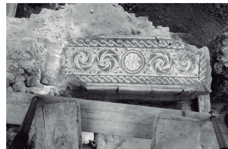
Lauda sepulcral cristiana del segle V trobada a les excavacions d'Antoni Maura