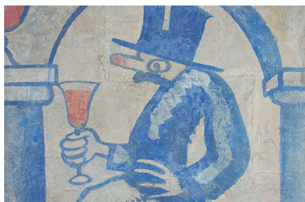
Fragment de la decoració mural del celler de les Galeries Laietanes. Xavier Nogués