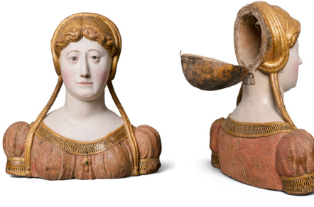
Bust reliquiari d'una santa, primer quart del segle XVI, Països Baixos o Alemanya.