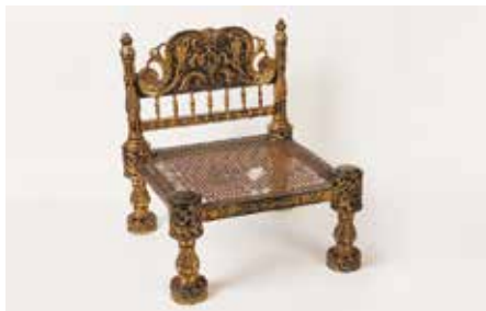
Cadeira de la Reina. MMP.