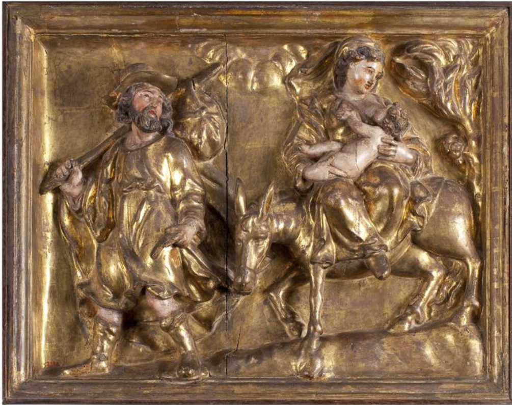
Compartiment de retaule. Fugida a Egipte Osona (?), segona meitat del segle XVII Talla de fusta policromada MFM 1195