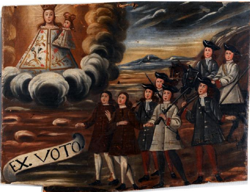
Exvot Catalunya, 1705-1714 (?) Pintura a l'oli sobre fusta Santuari del Miracle (Riner) MFM S-12553