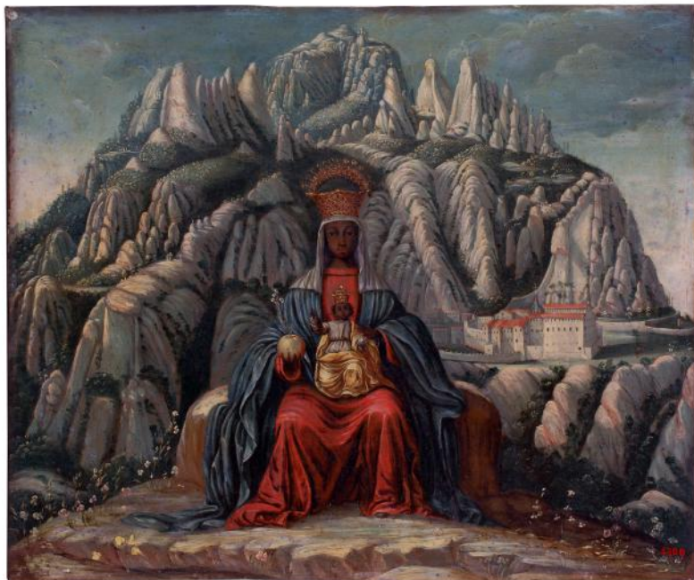
Mare de Déu de Montserrat Catalunya (?), segle XVII Oli sobre coure MFM S-300