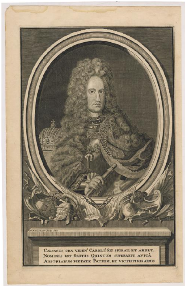
Carles III Hendrik Frans Diamaer (gravador) Anvers, primer terç del segle XVIII Aiguafort sobre paper Col·lecció Gelonch Viladegut