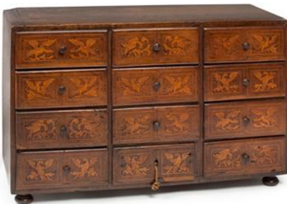
Escriptori Catalunya Final del segle XVII - primera meitat del segle XVIII Noguera, arbre de ribera i boix. Marqueteria MFM 4404