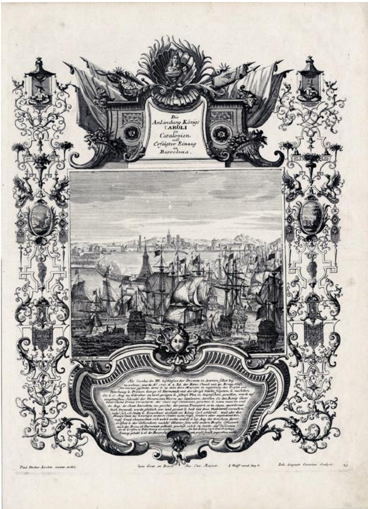
Arribada de l'arxiduc Carles d'Àustria a Barcelona el 1705 Paul Decker (dibuixant) i Johann August Corvinus (gravador) Augsburg, cap al 1715 Aiguafort sobre paper Col·lecció Gelonch Viladegut