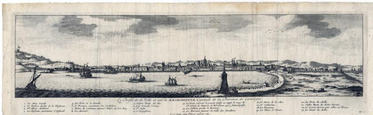
Vista de Barcelona Pierre Vander Aa (geògraf) Leiden, 1707 Aiguafort sobre paper Col·lecció Gelonch Viladegut