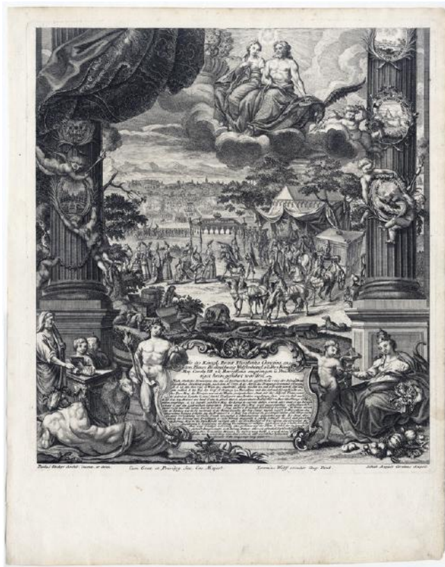
Carles III rep la reina Elisabet Cristina a Barcelona el 1708 Paul Decker (dibuixant) i Johann August Corvinus (gravador) Augsburg, cap al 1715 Aiguafort sobre paper Col·lecció Gelonch Viladegut