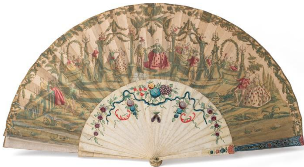
Ventall França (?) Segona meitat del segle XVIII Gravat acolorit sobre paper i os pintat MFM S-1413