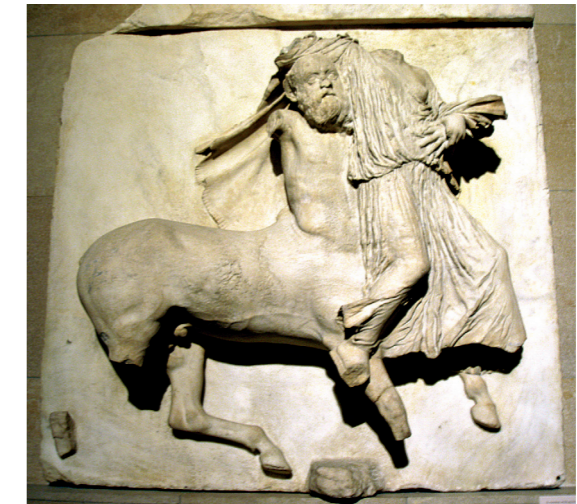
Centaures i lapites. Metopes del Partenó. British Museum

res i fins a l'actualitat, el centaure ha estat motiu d'inspiració de nombrosos artistes, des de Miquel Àngel i Botticelli a Rubens o Picasso entre molts d'altres.