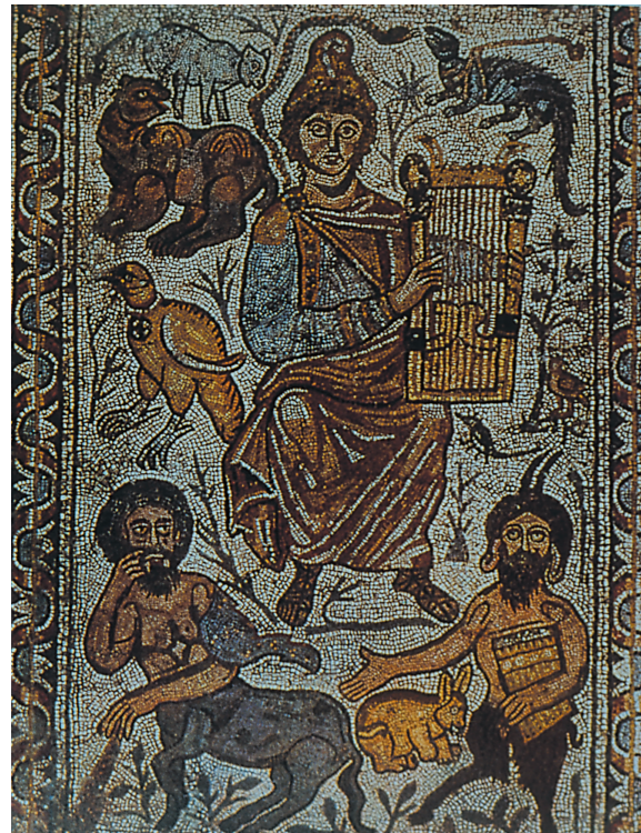
Orfeo entre animals. Mosaic procedent de Jerusalem. Segles V-VI. Museu Arqueològic d'Istanbul

Segons la literatura homèrica i els textos de Virgili i Ovidi, entre altres, els centaures són éssers violents i agressius, que viuen als boscos i les muntanyes, mengen carn crua i lluiten amb arcs i fletxes, troncs d'arbres o roques. L'embriaguesa, la persecució de les dones i la lluita són les seves pràctiques més habituals, encara que alguns acompanyen el carro de Dionisos i es refinen amb el tracte amb els homes. En aquest sentit, Quiró –conexedor de l'art de la medicina- i Folo són considerats centaures tranquils i hospitalaris que estimen i ajuden els homes.