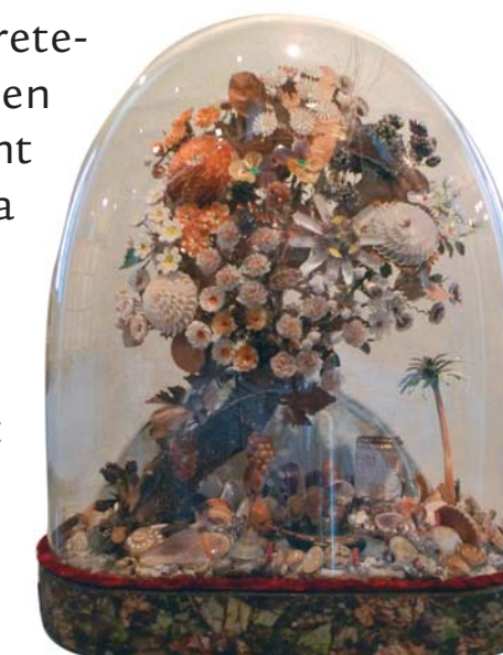
Florera de closques. MFM S-17816

Amb petxines es feien també imatges populars de sants, de les quals podem veure cinc exemplars a la sala.