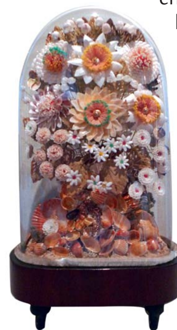
Florera de closques. MFM S-17817

enllà del seu valor decoratiu, aconseguïen dissimular l'encaix a la base. Elaborades amb petxines, caragols de mar, crancs, potes i banyes de crustacis, a partir d'un disseny previ, s'escollien les peces, s'anaven enganxant a l'ànima del ram, feta amb filferro folrat de roba, i finalment se'ls donava una capa de vernís incolor que els conferia un aspecte brillant. Els rams acostumaven a ser esvelts i vistosos, i en una mateixa composició s'agrupaven flors silvestres virolades, margarides, dàlies, crisantems o flors imaginàries.