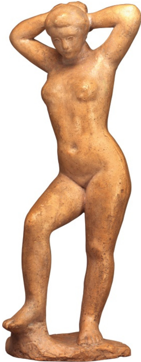
Banyista dreta pentinant-se, 1898-1900 Fundació Dina Vierny-Museu Maillol, París