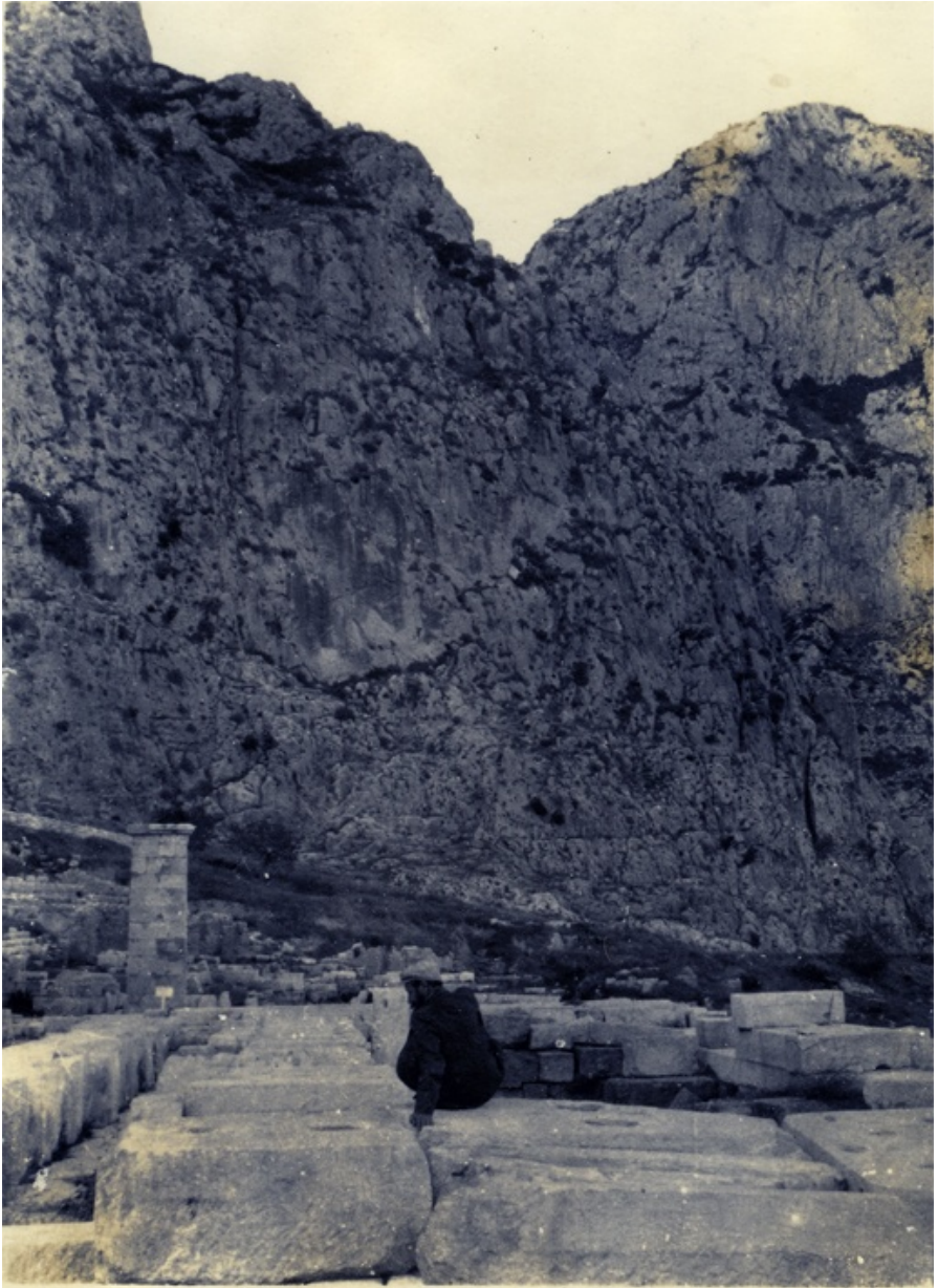
Maillol al santuari de Delfos