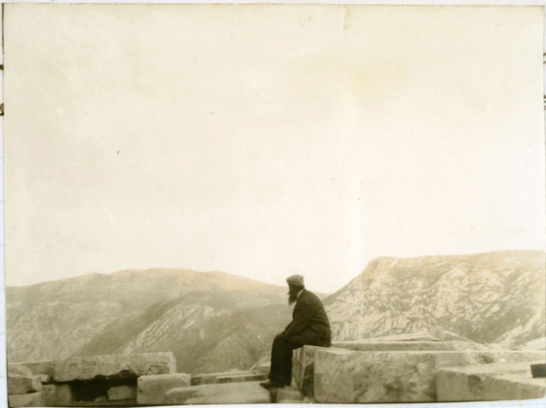
Maillol im Apollontempel, Delphi. 13. V. 08. Abends.

Maillol al santuari de Delfos