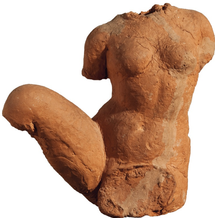
Tors, cap al 1905

La versió original és en francès, subtitulada en català, castellà i anglès.