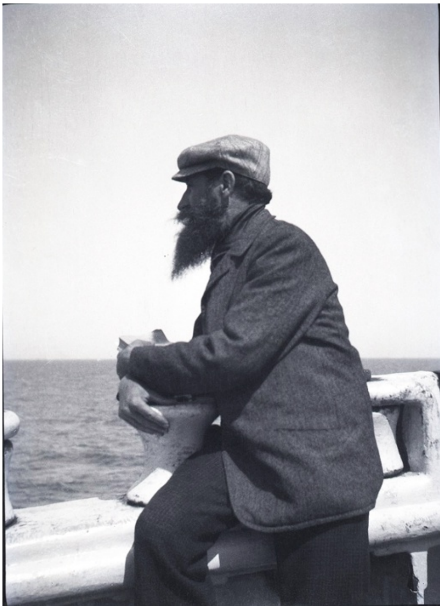
Maillol al vaixell