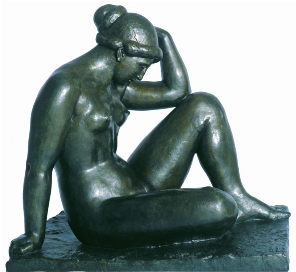
Mediterrània , 1905 Col·lecció particular Foto: Soci t  Arts-Franc SA   Jean-Alex Brunelle