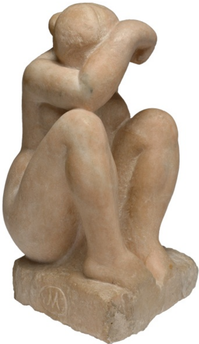
El pensament- Banyista ajudada , 1930 Fundació Dina Vierny-Museu Maillol, París