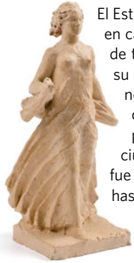
Figura al·legòrica, 1960-1970