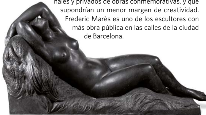
Nu ajagut (Plenitud, Primavera), cap al 1936

Frederic Marès es uno de los escultores con más obra pública en las calles de la ciudad de Barcelona.