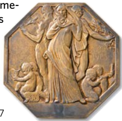
Medalla del Foment de les Art Decoratives, 1927

Frederic Marès Deulovol va néixer a Portbou l'any 1893 i va morir a Barcelona el 1991. El 1903, es va traslladar amb la seva família a Barcelona i l'estiu del 1908 va iniciar els seus estudis artístics a l'Escola Superior d'Arts i Indústries i Belles Arts, formació que va completar al taller de l'escultor modernista Eusebi Arnau (1863-1933). En acabar els estudis a l'Escola, l'any 1913, l'Ajuntament de Barcelona va concedir-li una beca d'estudis per passar uns mesos a París on va tractar antiquaris, col·leccionistes, intel·lectuals i artistes i conegué de primera mà l'obra d'Auguste Rodin (1840-1917). A partir del 1914, ja de nou a Barcelona, la influència de l'escultor francès i del modernisme d'Arnau és palesa en les seves obres, com també ho és la del moviment noucentista. Les obres realitzades per Marès entre els anys 1915 i 1925, aproximadament, responien a una escultura independent i de lliure creació, que abandonaria posteriorment per una obra que s'adaptaria als encàrrecs institucionals i privats d'obres commemoratives i que suposarien menys marge de creativitat. Frederic Marès és un dels escultors amb més obra pública als carrers de la ciutat de Barcelona.