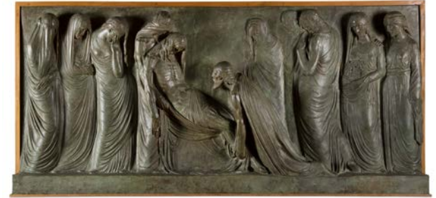
Enterrament de Crist, 1924

The Library-Study is the room where, as Museum Director, Frederic Marès had his office and received visitors. It conserved his library, personal objects, certificates and acknowledgements, historic documents from his and the Museum's collections as well as part of his own sculptural work, which was donated to the City of Barcelona in 1988. This unique, lived-in room was specifically designed in 1964, and it wasn't opened to visitors until 1996, five years after his death.