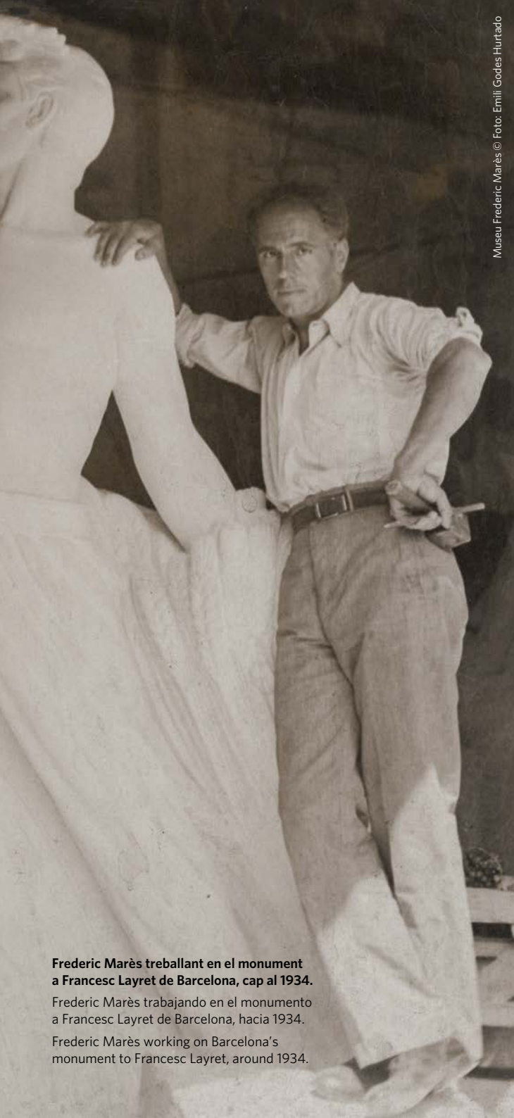
Museu Frederic Marès