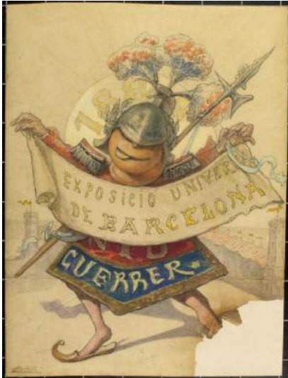
7. Guerrer Lluís Morell Cornet Llapis i aquarel·la sobre paper Barcelona, 1888 Museu Frederic Marès (MFM S-21527)