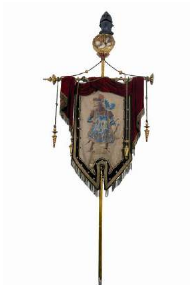
5. Estendard del Niu Guerrer Barcelona, 1884 (?) Museu Frederic Marès (MFM S-21605)