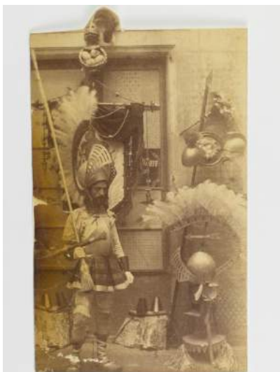
13. Soci del Niu Guerrer Fotografia Barcelona, final del segle XIX Museu Frederic Marès (MFM S-21534)