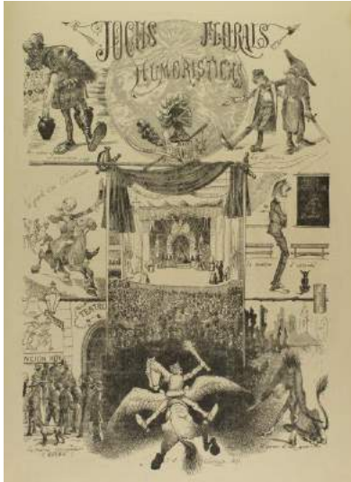
4. Jochs Florals Humorístics del Niu Guerrer Frederic J. Garriga Dibuix litografiat Agost del 1877 Revista La Llumanera de Nova York