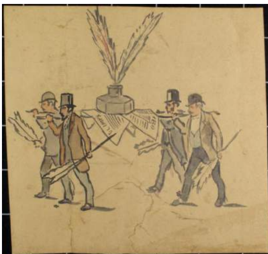
9. Comparsa de la Gran Pesquera al·lusiva a la premsa Aquarel·la sobre paper Barcelona, 1891 Museu Frederic Marès (MFM 5093)