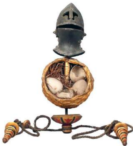
6. Niu d'ous i elm Coronament de l'estendard del Niu Guerrer Barcelona, 1884 (?) Museu Frederic Marès (MFM S-21605)