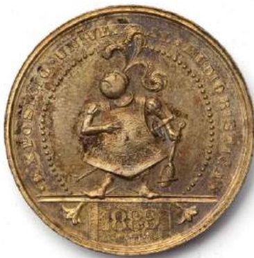
8. Medalla de l'Exposició Universal Humorística del Niu Guerrer Jacint Morató Barcelona, 1889 Museu Frederic Marès (MFM 5074)