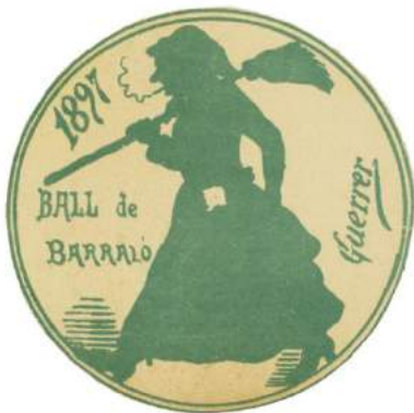
11. Invitació de ball de barraló del Niu Guerrer Paper imprès Barcelona, 1897 Museu Frederic Marès (MFM S-21422)