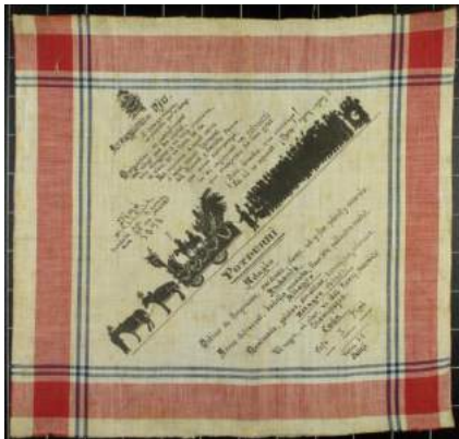
12. Tovalló del dinar Pallejà ofert als murguistes del Niu Guerrer Teixit estampat Barcelona, 1898 Museu Frederic Marès (MFM S-21272)