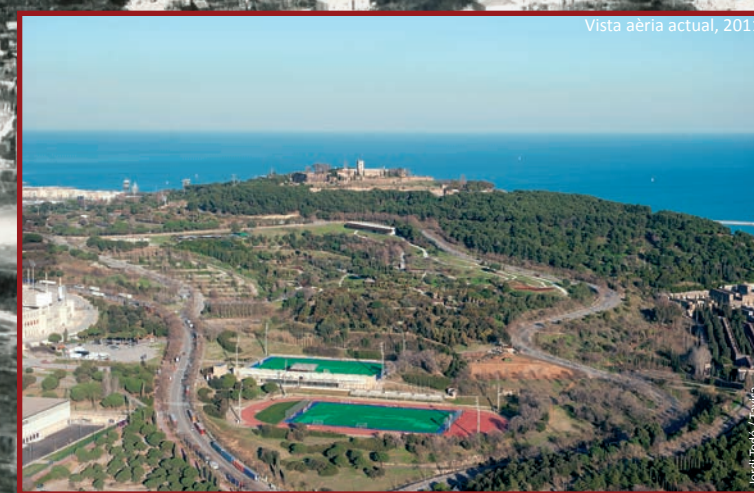
Vista aèria actual, 2011