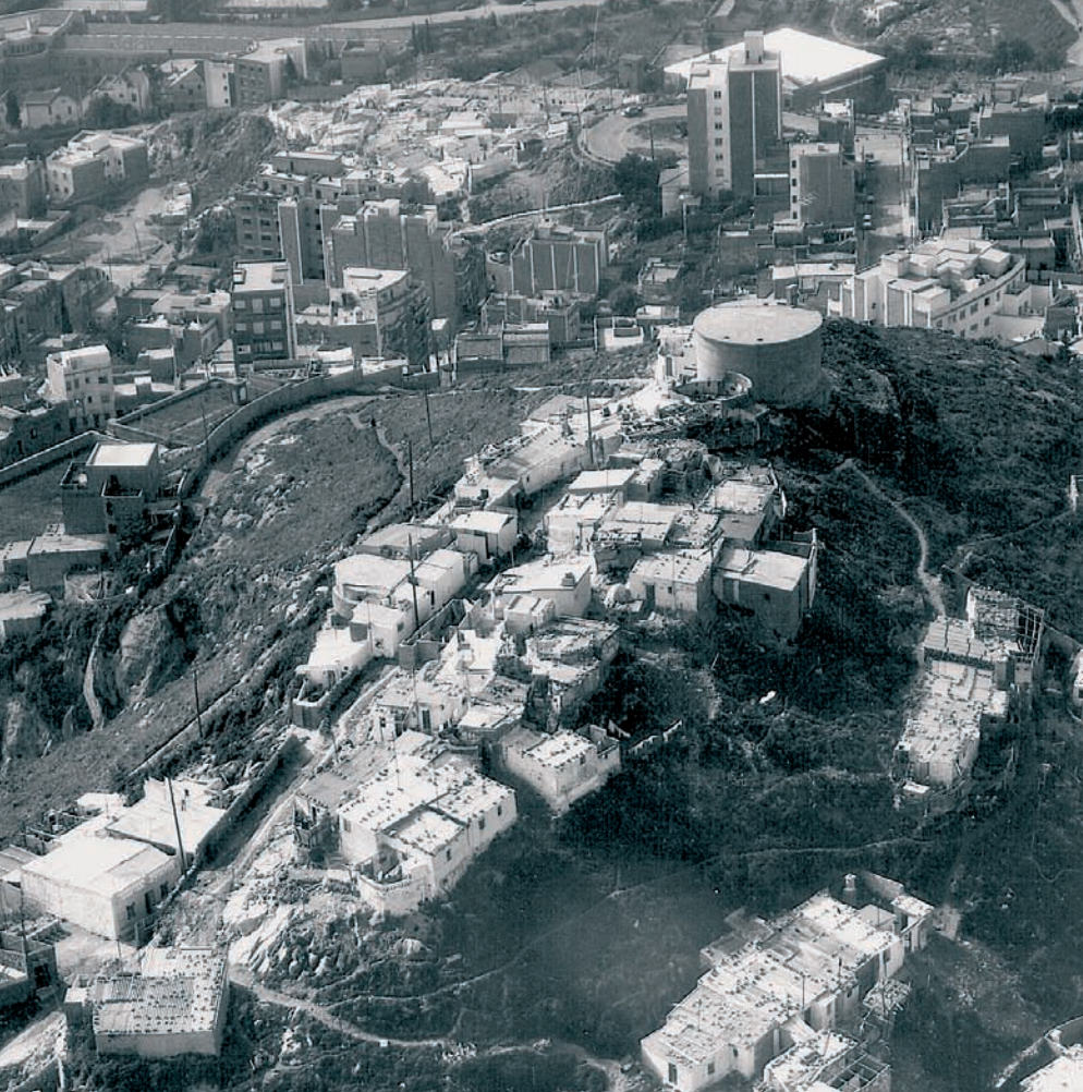
Vista aèria del Turó de la Rovira, 1972