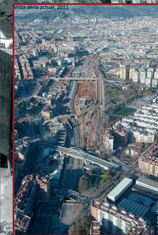
Vista aèria actual, 2011