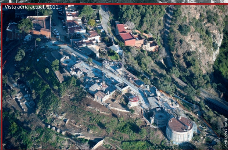
Vista aèria actual, 2011