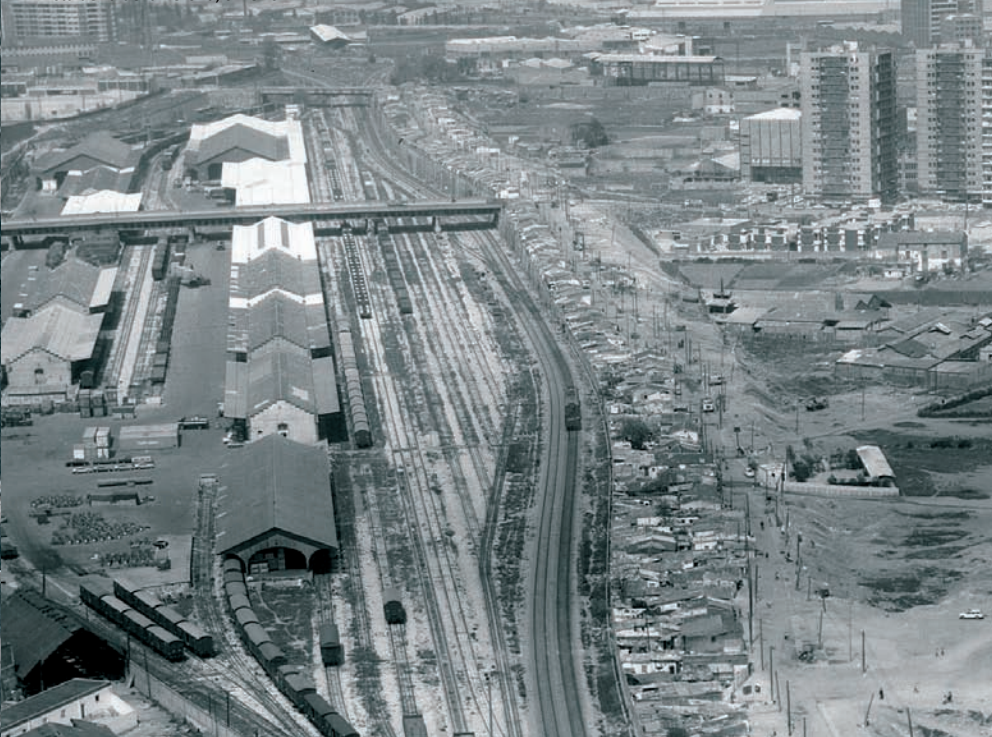
Vista aèria de la Perona, c. 1970

Els barraquistes van estar molts anys sense camins d'accés ni serveis de cap mena. El Centre Social del Carmel, que es va convertir en associació de veïns el 1972, va protagonitzar una intensa lluita reivindicativa fins a aconseguir la resposta de les institucions. El relatiu aïllament va fer que aquests nuclis fossin dels últims que van quedar a la ciutat. Els seus pobladors van reclamar la construcció de pisos a la mateixa zona, i ho van aconseguir l'any 1984, en un dels pocs exemples d'aquestes característiques que hi va haver a Barcelona. L'enderroc de les últimes barraques va arribar l'any 1990 i va simbolitzar la fi del barraquisme a Barcelona.