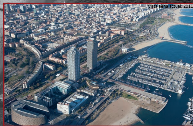
Vista aèria actual, 2011