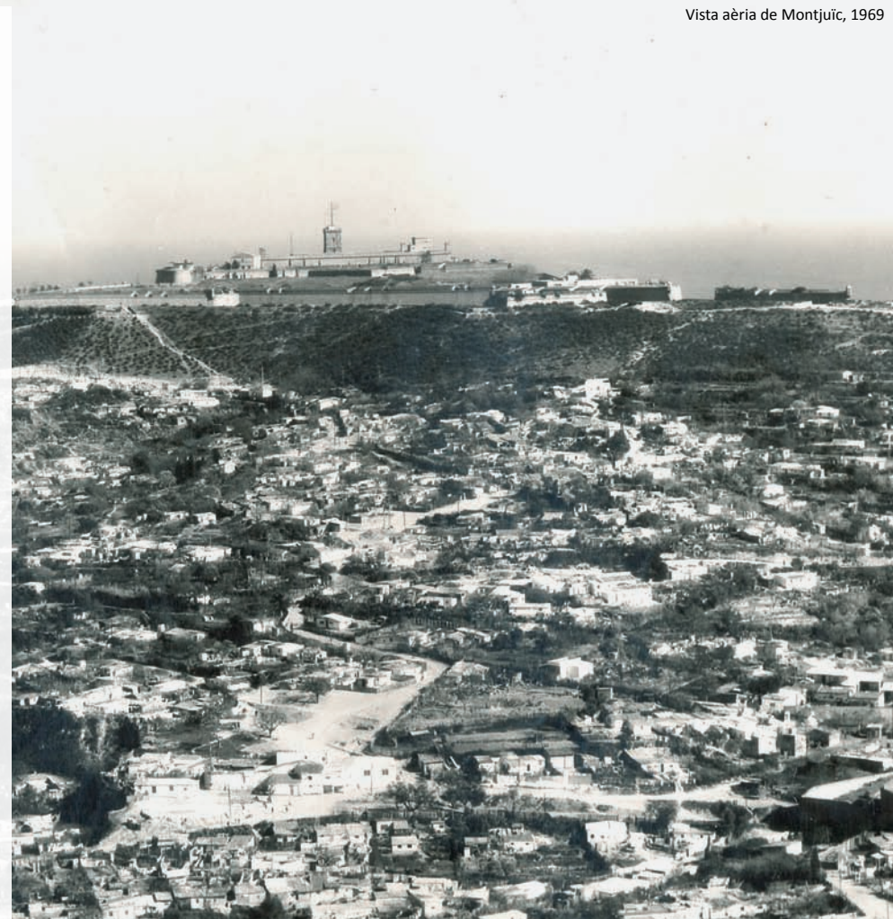
Vista aèria de Montjuïc, 1969

Les parròquies veïnes i alguns ordes religiosos hi van obrir algunes capelles, escoles i dispensaris. També van sorgir botigues, bars, espais de ball i cinemes improvisats, i es va anar creant un teixit social que a mitjan anys seixanta va permetre als barraquistes d'organitzar-se per reivindicar millores. Amb el lema "un pis per família", el seu combat va influir en la política de les autoritats franquistes, en un moment en què l'eradicació del barraquisme es convertia en prioritat política. Però la construcció dels polígons de realotjament avançava lentament i amb moltes mancances. El gruix de les barraques no va desaparèixer fins a l'any 1972.