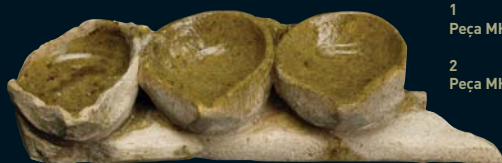
1 Peça MHCB 20375