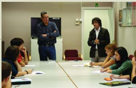
Sessió del Màster al Museu