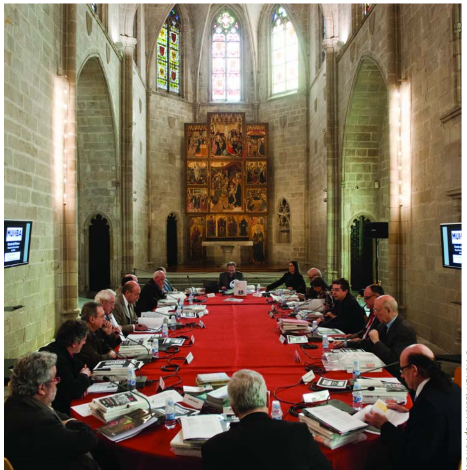
Reunió del cercle del MUHBA a la Capella de Santa Àgata