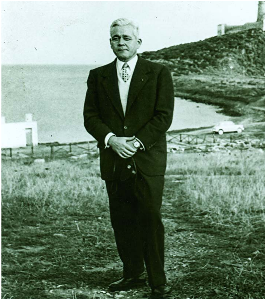
Jaume Vicens Vives al VI Congrés d'Història de la Corona d'Aragó, Sardenya, 1957

Les paraules de Vicens sobre Barcelona són fruit de la comprensió del paper central de la ciutat i les seves elits en l'articulació del país. Oscil·len entre l'enyorança d'uns temps mítics, que solen quedar fora de l'abast de l'observador, i la condemna per no haver sabut superar determinades proves en moments crucials, que són els que l'historiador ha volgut mirar de més a prop. La burgesia del seu temps, segons Vicens, no havia sabut exercir la funció integradora. El desbordament obrer