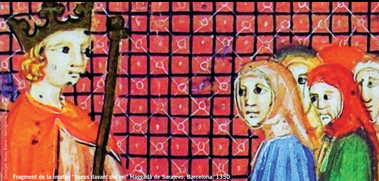
Fragment de la imatge "Jueus davant del rei" Haggadà de Sarajevo, Barcelona, 1350

L'atenció al patrimoni de la ciutat és l'altra cara de la dedicació a la història de Barcelona. Ni l'un ni l'altra vénen donats: es fan, i queda encara la tasca museística de construir vincles significatius entre relats, objectes i monuments. Si en el camp de la història ens fem ressò, en aquest número, de les relacions entre la monarquia, la ciutat i els jueus al segle XIII i de l'enginy de postguerra en la cerca d'oportunitats industrials amb els microcotxes, en la qüestió patrimonial el registre s'amplia. El Butlletí anterior es referia a les intervencions urbanes del Pla Barcino. En aquest, els articles s'interroguen sobre com abordar la música, la cuina, la pintura i el cinema, deturant-se a les pàgines centrals en els reptes que planteja la col·lecció de la Barcelona contemporània.