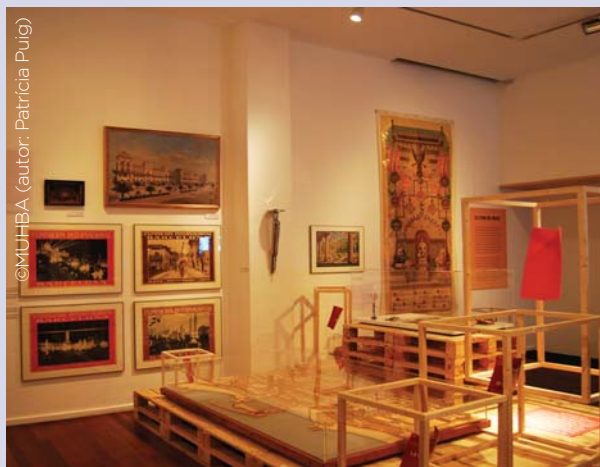
Laboratori MUHBA. Col·leccionem la ciutat