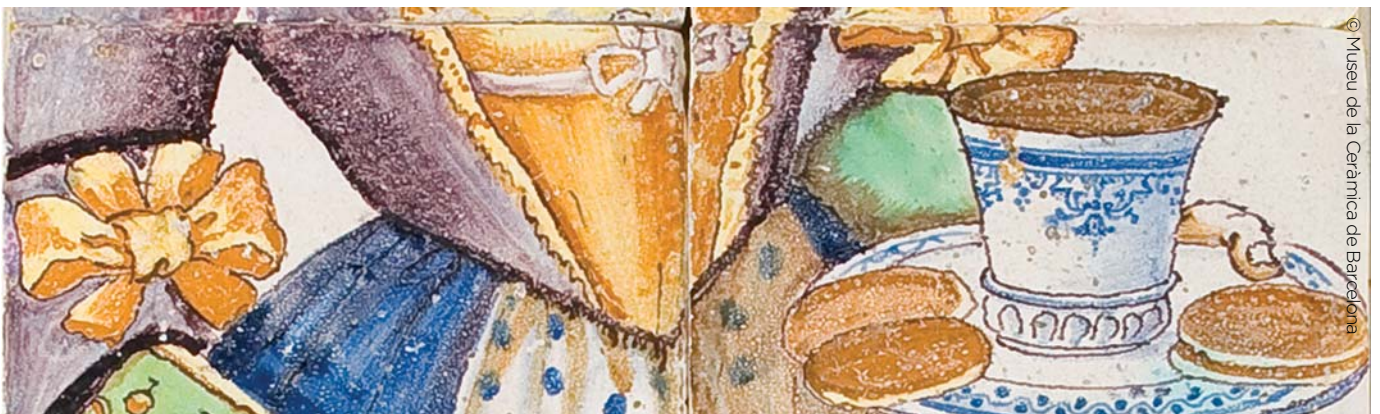
Dona servint xocolata. Plafó de rajoles de ceràmica, segle XVIII