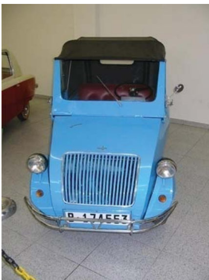
Biscúter 1958.

En certa manera, doncs, la producció d'aquesta mena de vehicles a