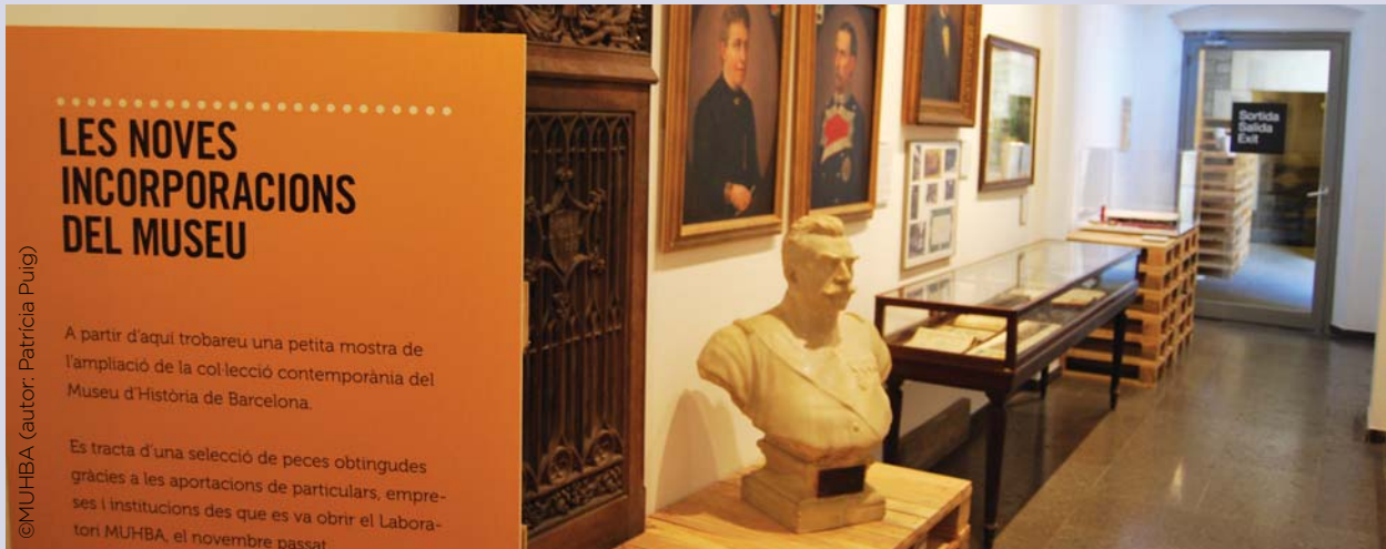
Laboratori MUHBA. Col·leccionem la ciutat.

en tant que reflex de la Transició: les campanyes pel català a l'escola, la recuperació dels noms dels carrers i dels locals ocupats per organismes de l'administració franquista, el debat sobre el divorci, la festa al carrer, la dinàmica associativa, etc.