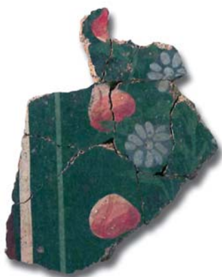
Lídia Font MUHBA