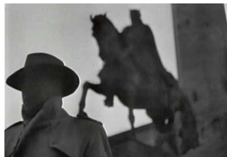
Fotograma de "El ojo de cristal" (Antonio Santillán, 1956).