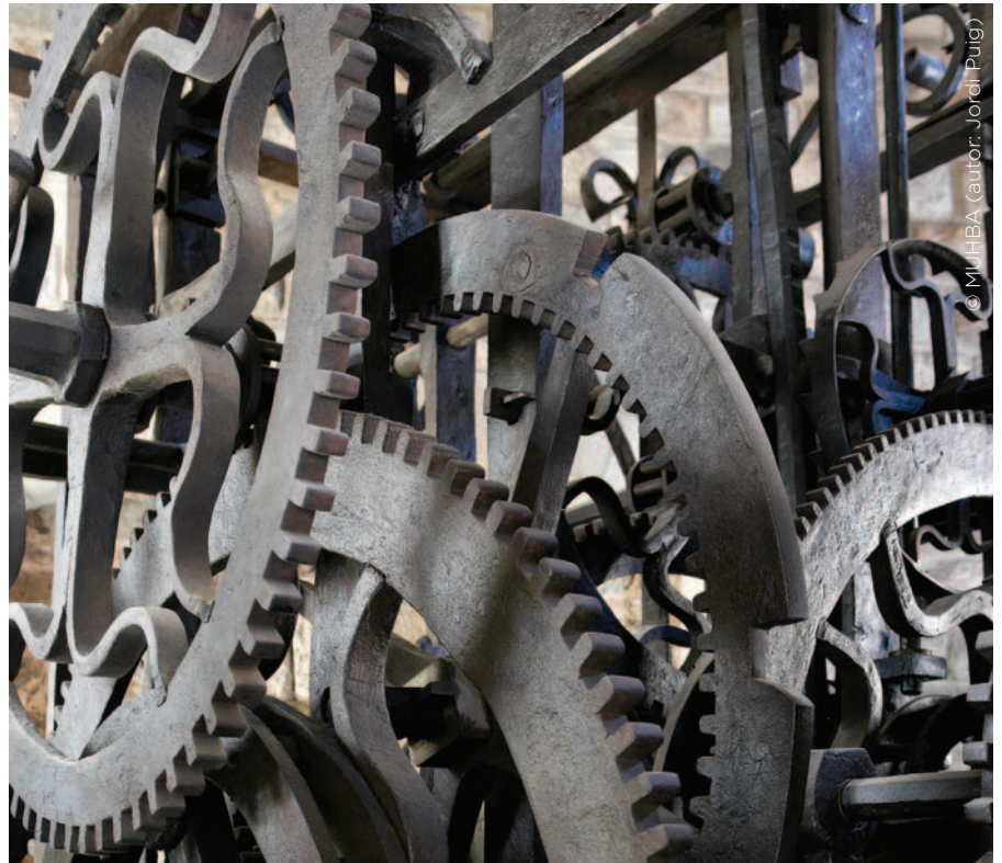
MHCB 11351. Gran Rellotge de Barcelona, 1577.

tes regles geomètriques, perfectament compreses pels constructors de l'edat mitjana, permeten dissenyar esglésies com Santa Àgata, voltes agosarades com la del Tinell i monuments entranyables com el monestir de Petras Albas . La mirada matemàtica sobre la imponent massa inert de ferro del rellotge, forjat el segle XVI per mestres flamencs, permet imaginar-ne el funcionament sense haver-lo de posar en moviment. Potser no ens apropa a comprendre el misteri del temps, però almenys hom s'adona de com oscil·lava l' esperit (balanci) i com aquestes oscil·lacions es transmetien a les maquinàries del temps, de les hores i dels quarts. Finalment, admirem Esteve Terrades, físic i enginyer de camins a més de matemàtic, amb una ment penetrant que va impressionar positivament el mateix Einstein, per una profunda mirada matemàtica que es reconeix en totes les seves obres.