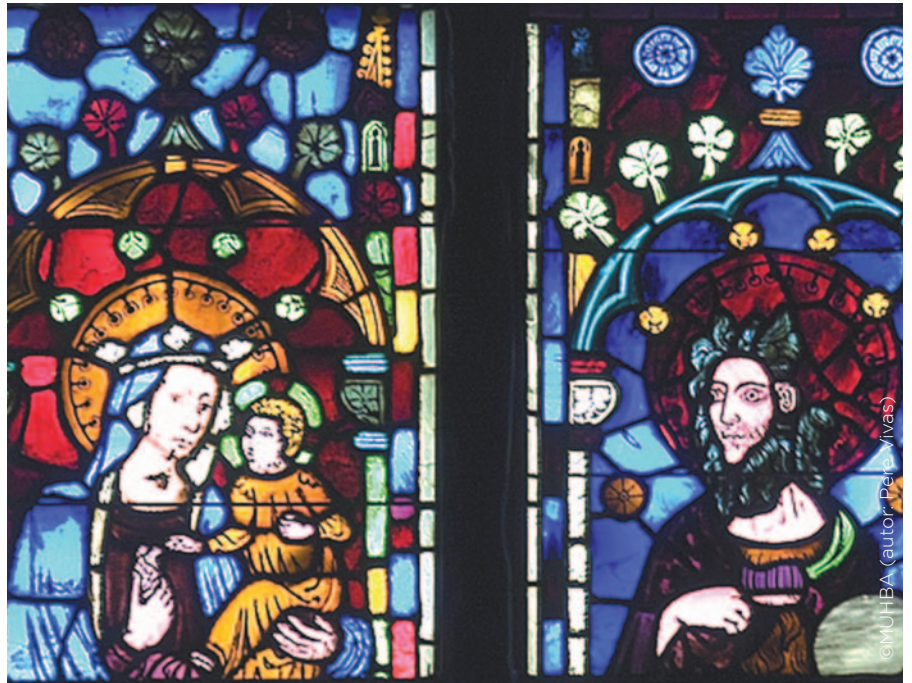
Fragment del vitrall central del presbiteri, s. XIV. Església de Santa Maria de Pedralbes.

I hores d'ara també coneixem millor la vida dins del monestir, arran de les excavacions arqueològiques d'un abocador dels segles XVI a XIX, supervisades pel Servei d'Arqueologia, amb motiu de les importants