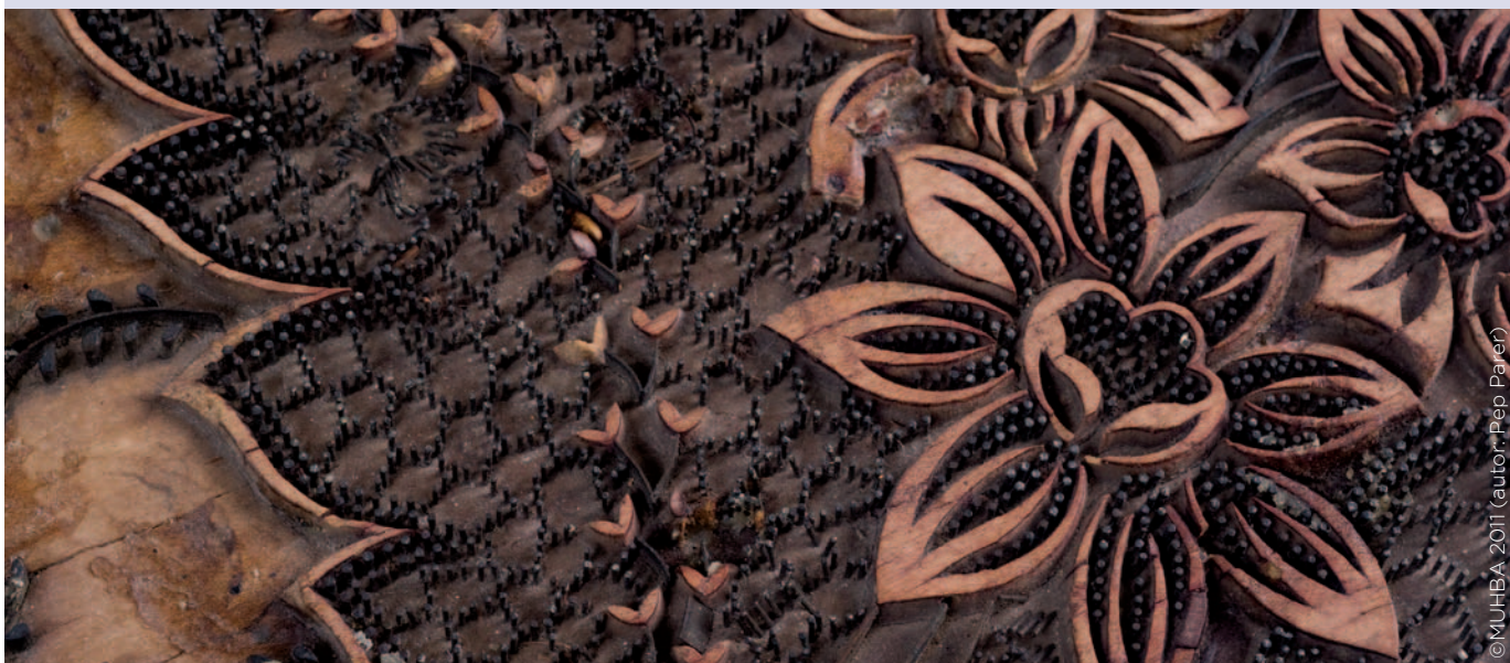
MHCB 3039. Mottle d'indianes.

taren les monarquies europees a fi de defensar els interessos de les tradicionals indústries de la llana i la seda. Això va obrir una oportunitat de negoci que ràpidament van aprofitar comerciants i mestres artesans. Ells van ser els primers a reunir, mitjançant la creació de societats mercantils, els capitals i els coneixements tècnics necessaris per produir a Barcelona els nous teixits. Uns coneixements que, en el cas de l'estampació, eren desconeguts i que van obligar a recórrer inicialment a especialistes estrangers, pagats a preu d'or, perquè ensenyessin els seus «secrets» als fabricants barcelonins. Impulsada per la iniciativa privada, la nova manufactura sorgia així com una combinació de capital mercantil, treball artesanal i tècniques estrangeres. Organitzades sota els principis de la manufactura centralitzada i capitalista, les fàbriques d'indianes eren empreses de notables dimensions caracteritzades per la concentració de la mà d'obra i la divisió del treball, que reunien en un mateix edifici les fases del teixit i l'estampat utilitzant tècniques de producció manuals. A partir d'aquestes premisses organitzatives i tècniques, la manufactura d'indianes va ser capaç de créixer de manera espectacular fins convertir-se en la primera indústria de la ciutat a finals del segle