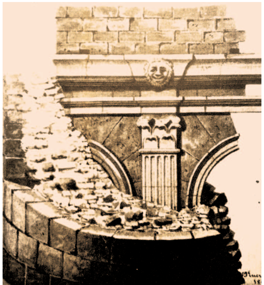
Enderroc al carrer del Regomir, 1862. Dibuix de Buenaventura Hernández Sanahuja.