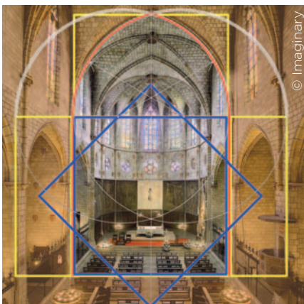
Església del Monestir de Pedralbes.

Imaginary/BCN. La mirada matemàtica, les arts i el patrimoni és una exposició interactiva pensada per a tots els públics, molt especialment per als estudiants de secundària. El seu contingut no és menys singular que la ubicació: la capella de Santa Àgata, a la plaça del Rei. La mostra parteix d'una exposició ideada pel Mathematisches Forschungsinstitut Oberwolfach (Selva Negra, Alemanya), a la qual s'han incorporat elements del patrimoni de la ciutat. Aquests elements s'han agrupat en quatre mòduls que enfoquen la mirada matemàtica. Es tracta dels frescos de Ferrer Bassa a la capella de Sant Miquel del monestir de Pedralbes; de l'arquitectura de tres edificis gòtics (la capella de Santa Àgata, el saló del Tinell i el monestir de Pedralbes); del «rellotge dels flamencs», regulador del batec de la ciutat des de la Torre de les Hores durant gairebé tres segles i actualment ubicat a la sagristia de la capella de Santa Àgata; i de les estacions de metro de la plaça Catalunya i de la plaça Espanya, remarcables obres civils projectades per l'eminent Esteve Terrades. En el mòdul sobre Ferrer Bassa el visitant s'adonarà que el pintor ja comprenia la perspectiva, d'una manera subtil que li permetia fer-la compatible amb els cànons estètics del moment, essencialment d'origen italià. En el cas de l'arquitectura gòtica, la mirada matemàtica, sense detreure ni un bri de l'austera bellesa dels edificis, mostra com unes quan-