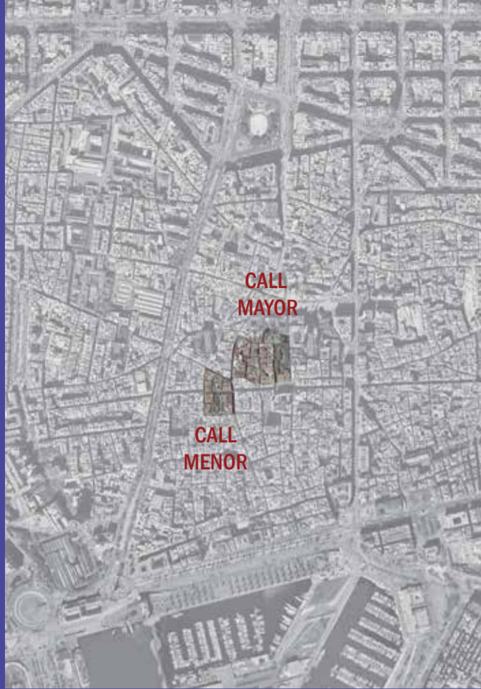
Ubicación del Call en la Barcelona actual. ICGC.

CALL MAYOR. La primera comunidad judía que residió en Barcelona debió de establecerse principalmente en el cuartel noroccidental de la antigua cuadrícula de Barcino, donde se formó el Call Mayor. A mediados de siglo XIII, el incremento de la población judía obligó a crear un segundo barrio judío, el Call Menor, cerca del primero pero fuera del recinto de la antigua muralla romana. Los límites del Call Mayor no eran totalmente precisos puesto que, de hecho, en algunas de sus zonas más periféricas se alternaban casas de judíos y casas de cristianos. Al sur estaba bien delimitado por la calle del Call, al oeste por la antigua muralla romana y, al este, debía de coincidir aproximadamente con el trazado de la actual calle del Bisbe. El límite septentrional es el más vago de todos ya que existían casas judías en la zona comprendida entre la actual calle de Sant Sever y la plazoleta de Sant Felip Neri.