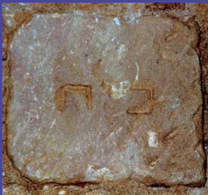
Sillar con la inscripción «casa» reutilizado en un edificio de la calle Arc de Sant Ramon.

Los restos epigráficos del Call se encuentran hoy en diferentes lugares de la ciudad, como resultado de la utilización de la piedra de las casas del barrio judío y de las lápidas de la necrópolis de Montjuïc en construcciones posteriores. La reutilización de materiales no era un hecho nuevo en la ciudad, sino una práctica habitual desde la época romana. En la calle Marlet, 1, se localizó la lápida conmemorativa de rabino Samuel ha-Sardí, mientras que los restos epigráficos empujados en los muros del Palacio del Lloctinent son muy visibles en la plaza de Sant Iu, en la plaza del Rei y en el recorrido arqueológico del Museo de Historia de Barcelona que discurre bajo la plaza y el palacio real.