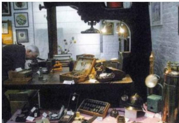
Els objectes de la Fabra

Ens fa falta la vostra col·laboració: conserveu algun objecte del vostre pas per la Fabra? Ens agradaria documentar-lo.