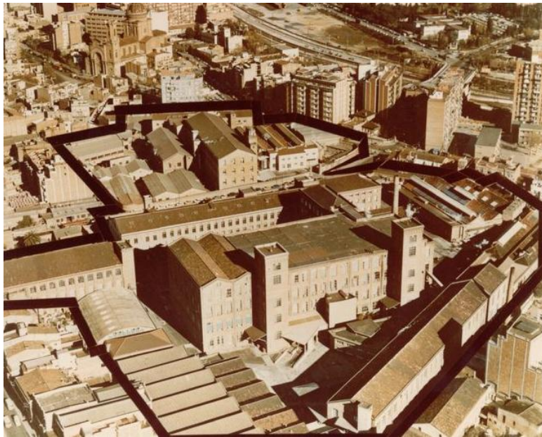
La Fabra i el barri

Fonamental en la industrialització de Barcelona, encara ara molts santandreuencs la senten com una cosa pròpia.