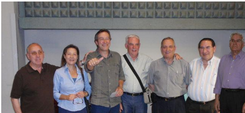
Las persones i la Fabra