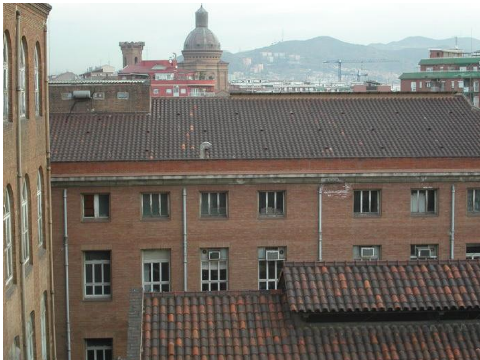
La Fabra i Coats on s'ubicarà el futur espai dedicat a les múltiples facetes del treball i la seva organització del MUHBA, Museu d'Història de Barcelona

Un museu socialment participatiu, amb els Amics de la Fabra i Coats i altres entitats de la ciutat. Un museu, bastit des de Sant Andreu i que a partir dels objectes, els documents, l'espai i la memòria d'una de les fàbriques més importants de Catalunya i Espanya, serà un element clau en la xarxa dels museus del treball europeus.