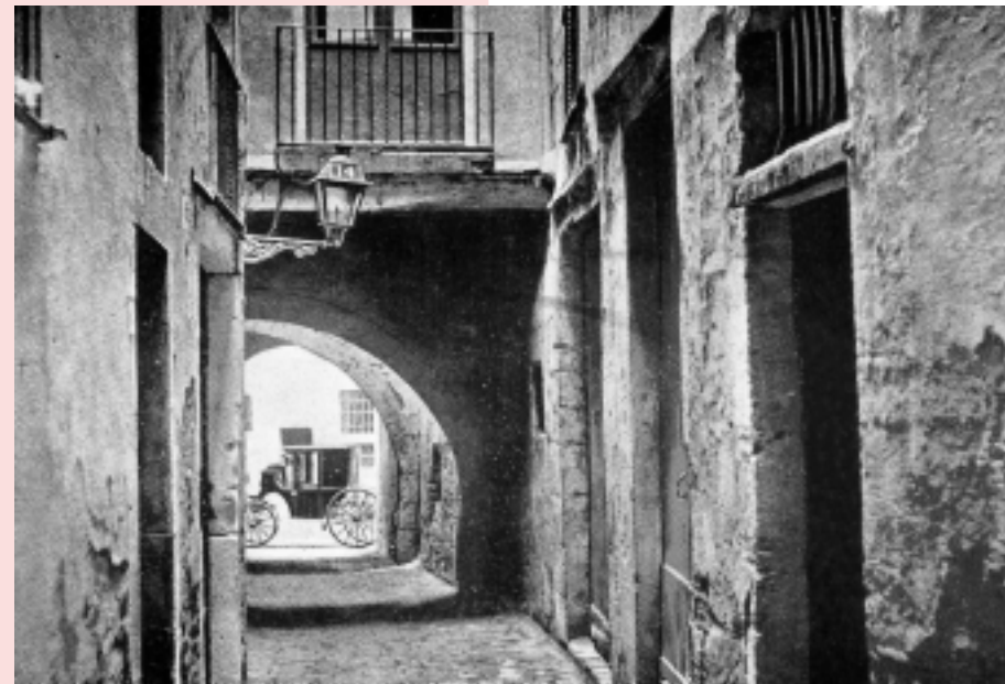
Carrer de les tres Voltes, 1908

Fins al 1854, la ciutat de Barcelona va estar envoltada de les muralles de l'època medieval. A partir de llavors la ciutat comença a créixer al voltant del passeig de Gràcia, més enllà del seus límits. És el moment de la construcció de l'Eixample. El gran creixement de la ciutat es va donar, però, amb l'annexió dels pobles del pla, l'any 1897. Això va comportar la incorporació d'antics municipis com ara Gràcia, Sants o Sant Martí de Provençals.