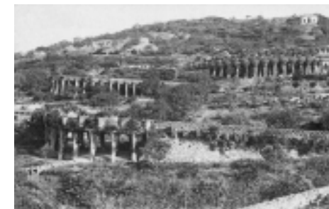
Viaducte del mig amb el tronc de garrofer