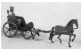
Carrossa de passeig

Indica les diferents instal·lacions del Park.