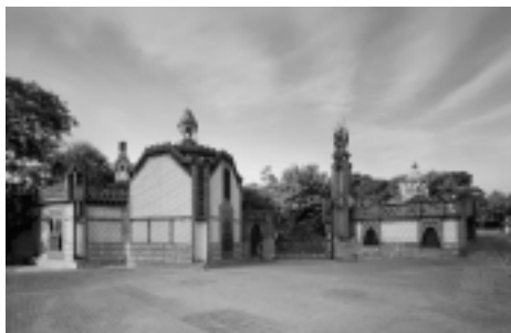
Pavellons Güell

Què significa ser mecenes? Què va significar per a Gaudí tenir Güell de mecenes?