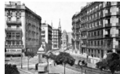
Carrer de Balmes a començaments del s. xx