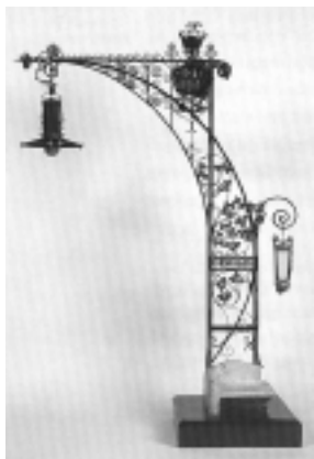
Maqueta dels fanals del Passeig de Gràcia © Ramon Muro-MHCB