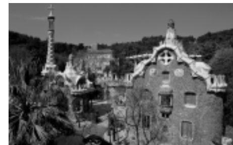
L'entrada del carrer Olot