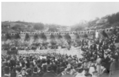
Una celebració dins el Park.

Si el Park Güell havia de ser una ciutat-jardí, com expliques el fet que es convertís en un parc públic?