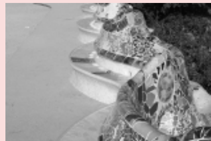
Els bancs