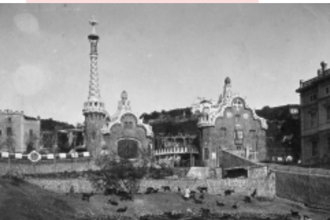
El Park en construcció, 1908

El Park es comença a construir el 1900 com una ciutat-jardí. Va ser promoguda per l'industrial i financer Eusebi Güell. Per fer-la es va triar la Muntanya Pelada, al barri de la Salut, que formava part del terme municipal de Gràcia. S'havien de fer unes 40 cases envoltades de jardí que disposarien de molts serveis: una porteria, un mercat, una plaça central, una capella i molts serveis nous per a l'època, com ara el telèfon. Un barri residencial amb un mur de tancament i servei de vigilància. Un lloc inaccessible, fins i tot per als tramvies, on només podia anar a viure un grup molt reduït de les famílies de l'època.