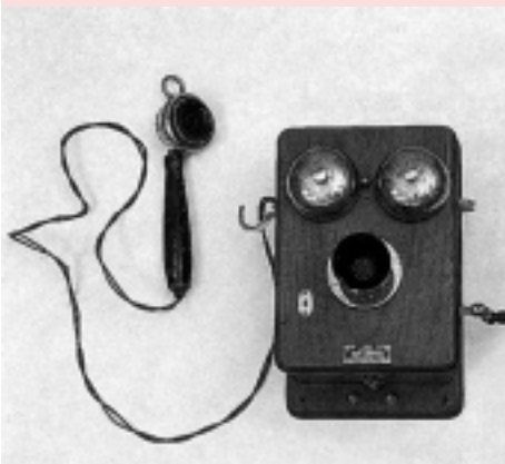
Telèfon