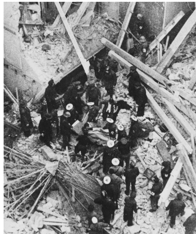
Guerra civil: bombardeig sobre la població civil, 30-01-1938.