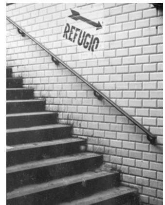
Escales d’entrada a l’estació de Provença dels FFCC, amb el rètol indicador de refugi, Barcelona.