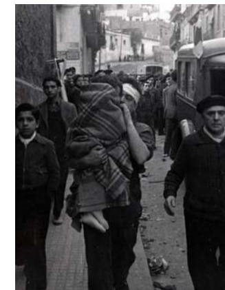
Víctimes del bombardeig del 16 de març al Poble-sec, 1937.

Coneixeu algun altre cas de bombardeig sistemàtic sobre la població civil i indefensa? Esmenta tres conseqüències d’aquests atacs.