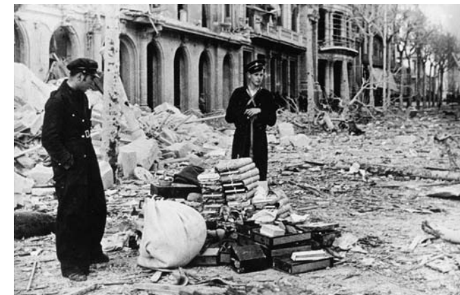
Guerra civil: bombardeig de la ciutat, 17-03-1938. Autor desconegut.

“El 23 de desembre de 1938 les tropes franquistes iniciaren l'ofensiva final contra Catalunya. Davant tenien un exèrcit desgastat, mal armat i desmoralitzat. En aquestes circumstàncies la ruptura del front fou ràpida i l'exèrcit franquista inicià un avanç que ja no s'aturaria fins arribar a la frontera francesa. A la rereguarda regnava un clima de desencís i de fatalisme. A Barcelona, com a la resta de Catalunya, el desànim era general. La moral de la població estava minada pels constants bombardeigs que durant aquests dies augmentaren en intensitat, la manca de queviures i la sensació d'haver estat abandonats per les potències democràtiques. L'arribada dels refugiats de la resta de Catalunya era el preludi de l'arribada dels franquistes. (...) El diumenge 22, Juan Negrín comunicà a Lluís Companys la impossibilitat de resistir a Barcelona, i la conveniència d'evacuar la ciutat. Començava un èxode que per a molts seria definitiu. El dia 24, vigília de l'ocupació militar de la ciutat per l'exèrcit franquista finalitzaren els bombardeigs sobre Barcelona.”