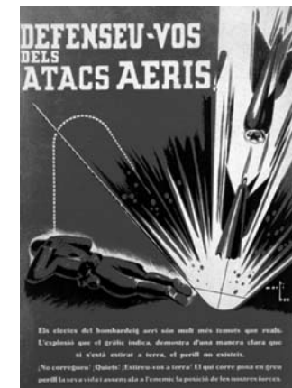
Cartell informatiu editat per la Generalitat de Catalunya en el període inicial on es fa palès l'optimisme respecte a la perillositat dels bombardeigs:

La Publicitat, dijous, 3 de març de 1938.