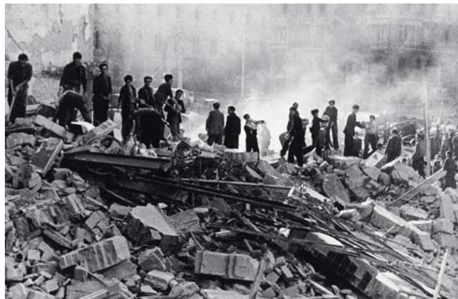
Guerra civil: bombardeig sobre la ciutat, 16 de març de 1938.

Antonio Monegal, Francesc Torres, José M. Ridao, En guerra , Barcelona, CCCB, 2004