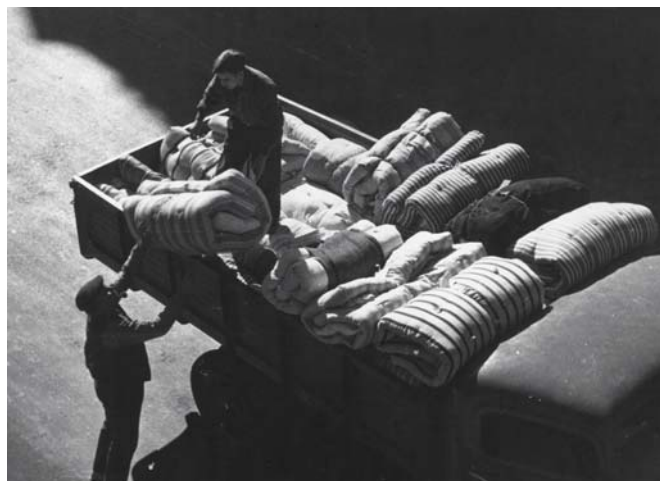
Recollint matalassos per als refugiats. 21 d'octubre de 1936, Pérez de Rozas, AHCB-AF, © ICUB

Albertí, S. i E., Perill de bombardeig! Barcelona sota les bombes (1936-1939), Albertí Editor S. L., Barcelona, 2004.