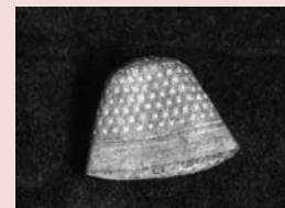
Didal de bronze, Segles XV-XVII