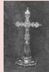
Creu d'altar. Segle XIV