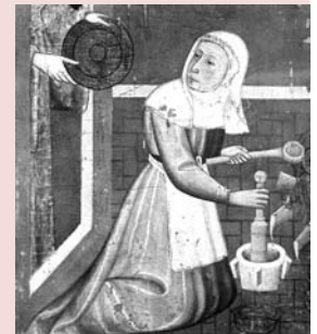
Detall del compartiment del naixement de la Verge, d'un retaule dedicat a Santa Anna