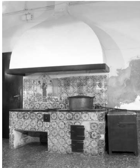
Fogons de carbó

Qui era el responsable de la salut de les monges? Què te'n diu, això, de l'organització del monestir?