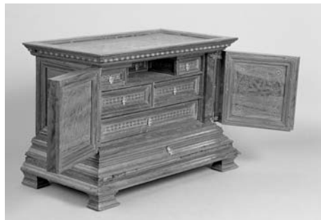
Arquimesa. Segle XVI

Tot monestir s'organitza al voltant d'una regla estricta que en regeix la vida i el funcionament. La reina Elisenda, seguint els corrents espirituals de l'època, va escollir l'orde de les clarisses per habitar el nou monestir de Pedralbes. Aquestes religioses seguïen la regla de Santa Clara, que regia tota la seva vida. Es basava en els tres vots essencials que definien la vida monàstica des de Sant Benet de Núrsia [480-547]: obediència, castedat i pobresa, i n'hi afegia un de nou, el de la clausura.