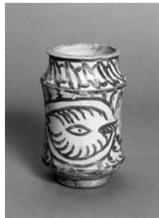
Ceràmica oxidada. Segles XIV-XV