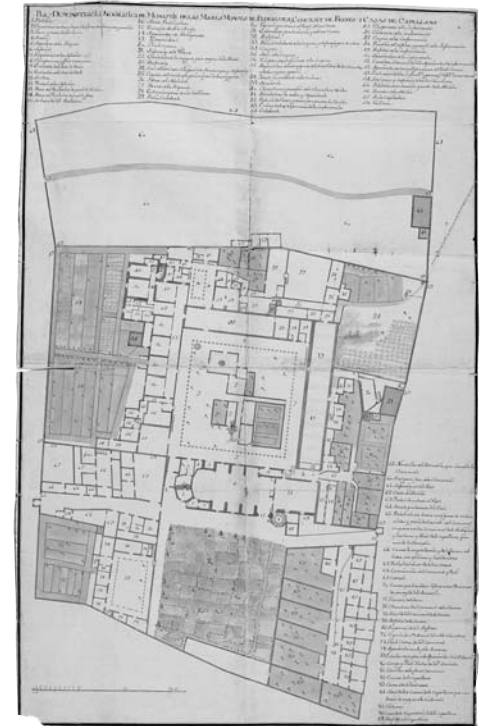
El Monestir de Pedralbes al segle XVI

Situa al plànol els espais externs a la clausura i els interns. Què et diuen del funcionament del monestir?