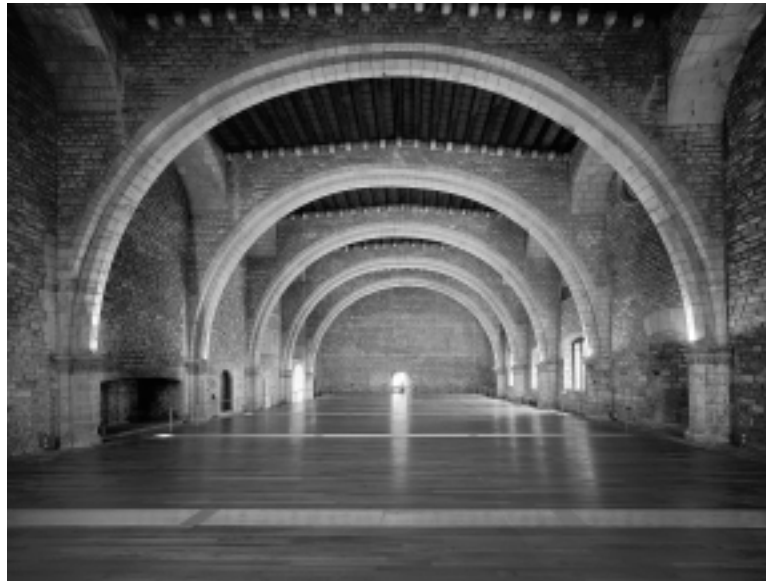
El Saló del Tinell

Al llarg d'aquesta ruta anota les parts de l'itinerari reial per on passem, i també allò que ha desaparegut o s'ha transformat.