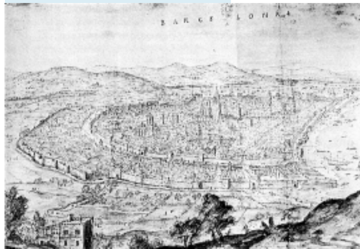
..... Vista de la ciutat des de Montjuïc A. Van der Wyngaerde, 1563

Imagina que ets el rei: pensa dues preguntes que faries als consellers per saber més coses de la ciutat.