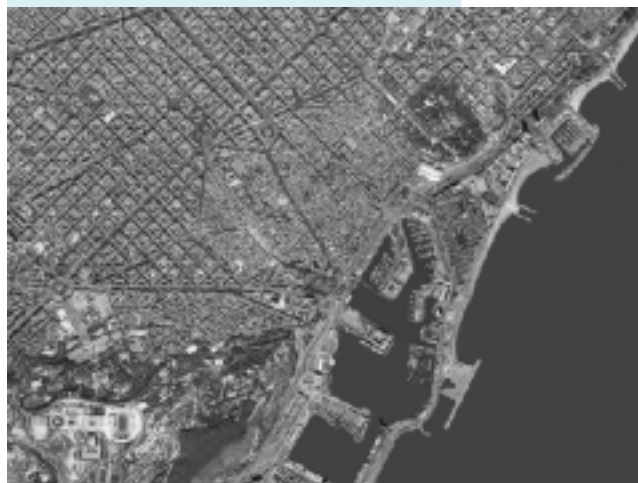
..... Ciutadella amb l'Esplanada i sector urbà proper