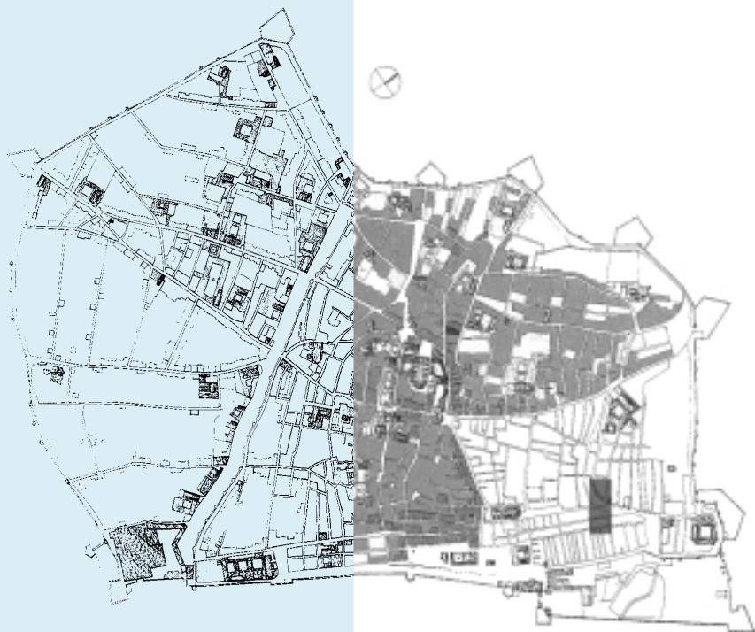
La ciutat el 1714

Quan mor Ferran el Catòlic, el seu nét, Carles, és nomenat rei, perquè el seu pare, Felip el Bell, era mort i la seva mare, Joana, havia embogit de dolor. Sense pares que en poguessin tenir cura, el petit Carles ha estat educat a Gant, als Països Baixos, a la cort de l'emperador Maximilià, el seu avi patern. Només parla flamenc, i els regnes heretats li són estranys i desconeguts.