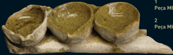
1 Peça MHC B 20375