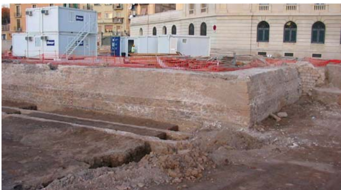
Vista general de les restes arqueològiques del Baluard de Migdia