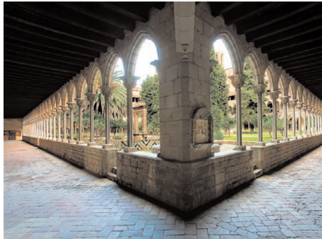
Claustre del Museu-Monestir de Pedralbes.