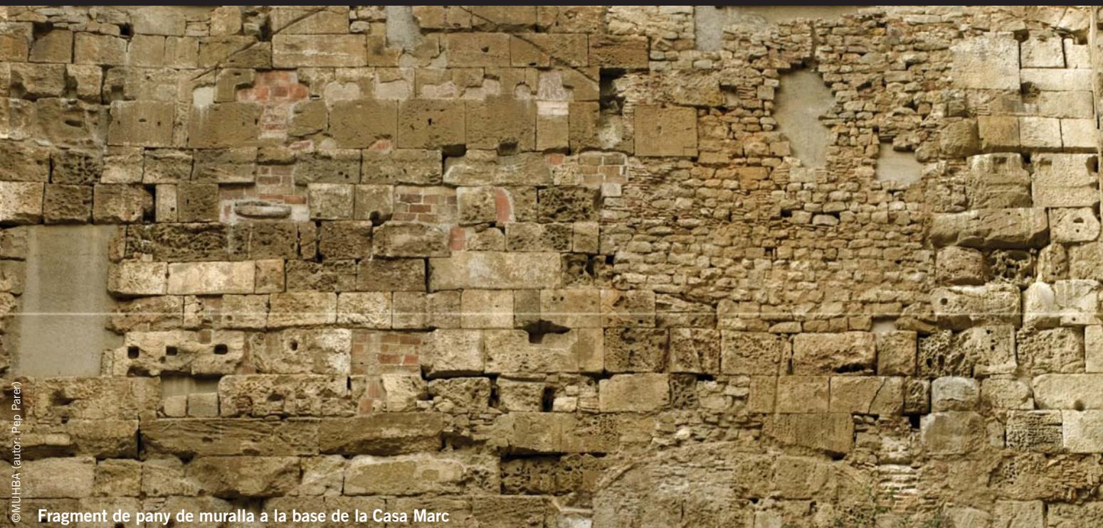
Fragment de pany de muralla a la base de la Casa Marc

En temps difícils com els que ara vivim, la recerca històrica ens pot ajudar a valorar els grans desastres del passat, però també pot ser útil per conèixer com va ser possible de tirar endavant. Si les muralles del segle IV, incorporades avui al paisatge del nucli històric, foren decisives per a la continuïtat urbana entre Barcino i la capital medieval, l'exposició "Indianes 1736-1847. Els orígens de la Barcelona industrial", que s'acaba d'inaugurar, mostra com la creativitat, el treball i la receptivitat a la innovació foren cabdals per mitigar el traumàtic inici del segle XVIII, amb la desfeta de 1714, i per posar les bases de la moderna ciutat industrial: "el nostre enginy, el nostre cor, la nostra llançadora", deia el diari El Vapor l'any 1834. Una ciutat que finalment va poder enderrocar les muralles que aleshores la limitaven i avançar cap a la Barcelona de l'Eixample i les exposicions, capital renascuda de Catalunya davant d'Europa.