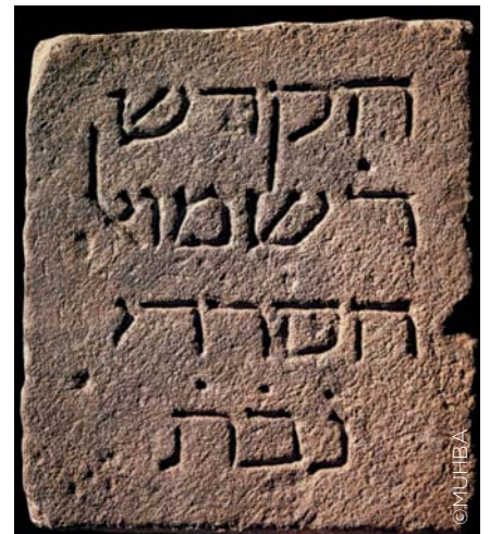
Làpida del carrer Marlet dedicada a Xemuel ha-Sardí