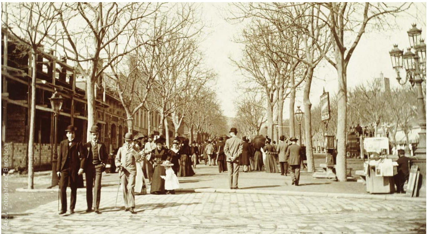
Passeig de Gràcia, 1902