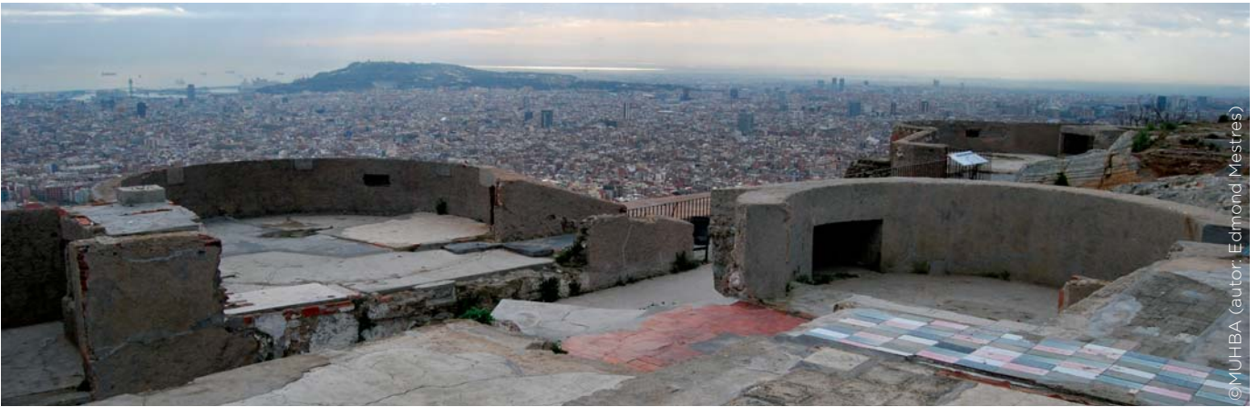
Vistes des de les bateries del Turó de la Rovira

El març del 2011 es va inaugurar el nou espai patrimonial del Turó de la Rovira, que va significar l'arranjament i l'actuació patrimonial en un indret de la ciutat, fins llavors força degradat, aïllat i desconegut, on es conservava una bateria antiaèria que va defensar Barcelona dels atacs de l'aviació durant la Guerra Civil, així com les traces del nucli barraquista del barri dels Canons.