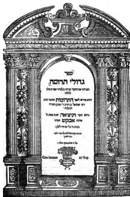
Comentari al Séfer ha-Terumot d'Azarià Figo imprès a Venècia el 1643

Xemuel ha-Sardí va ser amic de Moixé ben Nakhman (Nakhmànides), una de les personalitats més remarcables del judaisme català medieval, i també del rabí provençal Natan ben Meïr de Trinquetaille, dels qual rebé algunes responsa que va incloure en el seu Séfer ha-Terumot ('Llibre de les ofrenes'). Aquesta obra és l'única que ens és pervinguda i conservada escrita per ell, tot i que sabem que no fou pas l'única que escrigué. La redactà quan tenia uns trenta anys, cap al 1223, i és un llibre eminentment de jurisprudència civil i comercial, el pròleg del qual diu així: «per tal que les lleis relatives als préstecs, tan escripturats com orals, o les relatives als drets i les obligacions de prestadors i prestataris, es puguin trobar en el mateix lloc. A vegades els deutors defrauden els creditors amb subterfugis, enganys, falsedats, insolència i arteria. Alguns defrauden perquè no tenen prou mitjans