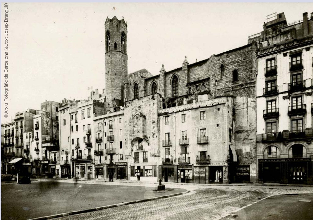
Carrer Tapineria, 1910