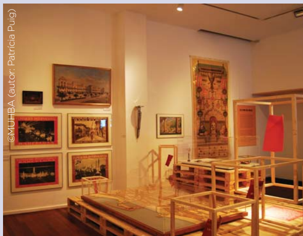
Laboratori MUHBA. Col·leccionem la ciutat