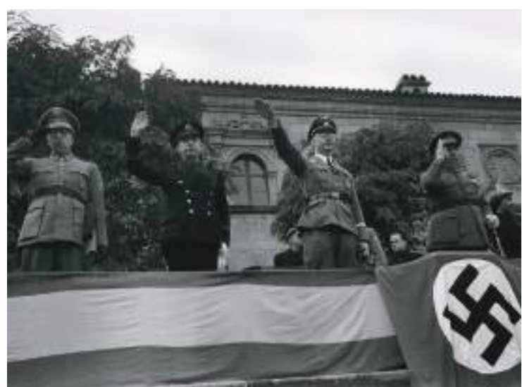
Visita de Heinrich Himmler a Barcelona, Poble Espanyol, 23 d'octubre de 1940.

vintè aniversari de la Marxa sobre Roma com a manera d'agrair els serveis prestats durant la guerra. Hi havia també un altre factor d'agraïment: Itàlia era un exemple i un mirall. Havia estat el país precursor, el primer a alçar-se contra el món caduc del liberalisme i el desafiament del comunisme. Havia obert el camí pel qual ara transitaven l'Alemanya nazi i l'Espanya franquista. L'acte es va celebrar a la Casa dels Italians el 25 d'octubre de 1942 i hi van assistir les principals autoritats diplomàtiques, polítiques i militars de la ciutat. Amb aquest gest, Barcelona recollia la satisfacció italiana dels vint anys de feixisme i felicitava Benito Mussolini «per la prodigiosa obra de veinte años de trabajo, de desvelos y de eficacia».