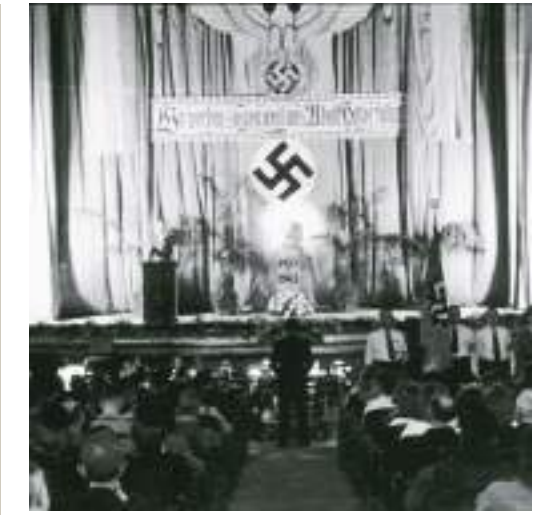
Desè aniversari de l'ascens de Hitler al poder, 31 de març de 1943.

D'aquesta manera, Barcelona va ser redimida i va expiar els seus pecats rojos i republicans.