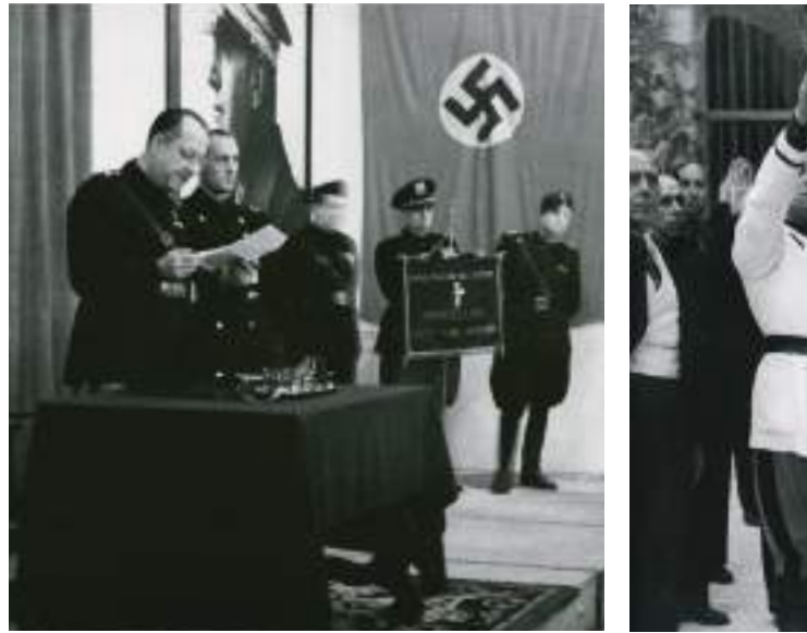
Commemoració del vintè aniversari de la Marxa sobre Roma, Casa dels Italians, 25 d'octubre de 1942. Pérez de Rozas. AFB