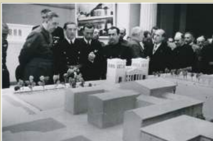
Exposició d'Arquitectura Moderna Alemanya a Barcelona, 20 d'octubre de 1942.

La primera fou l'Exposició del Llibre Alemany, celebrada el febrer de 1941 al Paraním de la Universitat de Barcelona. Aquesta ubicació no era una casualitat. En primer lloc, l'impacte visual de tres esvàstiques penjades a la façana de la Universitat ja era prou simptomàtic: el nou ordre europeu havia arribat al cor de Barcelona. I en segon lloc, es podia llegir com la comunió definitiva entre l'acadèmia i la nova ideologia dominant. La Universitat de Barcelona havia estat rescatada dels rojos i separatistes per donar la benvinguda als camarades alemanys.