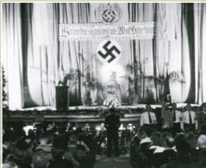
Desé aniversari de l'ascens de Hitler al poder, 31 de març de 1943.