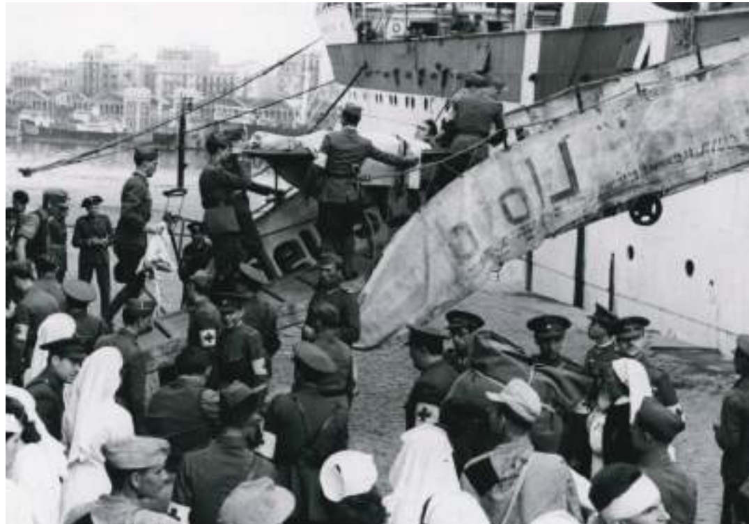
Intercanvi de presoners al port de Barcelona, 27 d'octubre de 1943.

i d'enorme impacte visual. A més d'aquestes dues visites de màxim ressò internacional, Barcelona acollí també una llarga llista de visites diplomàtiques, acadèmiques, militars i d'esdeveniments socials i culturals que la van convertir en una ciutat «amiga» de feixistes italians i nazis alemanys; evidentment, amb el vistiplau i la col·laboració de les principals autoritats espanyoles i barcelonines. D'aquesta manera, Barcelona va ser redimida i va expiar els seus pecats rojos i republicans.