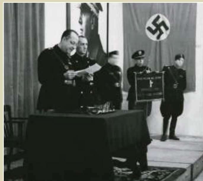
Commemoració del vintè aniversari de la Marxa sobre Roma, Casa dels Italians, 25 d'octubre de 1942.

Encara que les afinitats amb el feixisme italià eren força més importants i visibles que no pas amb el nazisme, la presència italiana a Barcelona entre 1939 i 1943 va ser més discreta. Probablement, l'evolució de la guerra i el trist paper que hi va fer el règim italià expliquen aquesta menor intensitat i visibilitat. Tan-