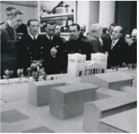
Exposició d'Arquitectura Moderna Alemana a Barcelona, 20 d'octubre de 1942.