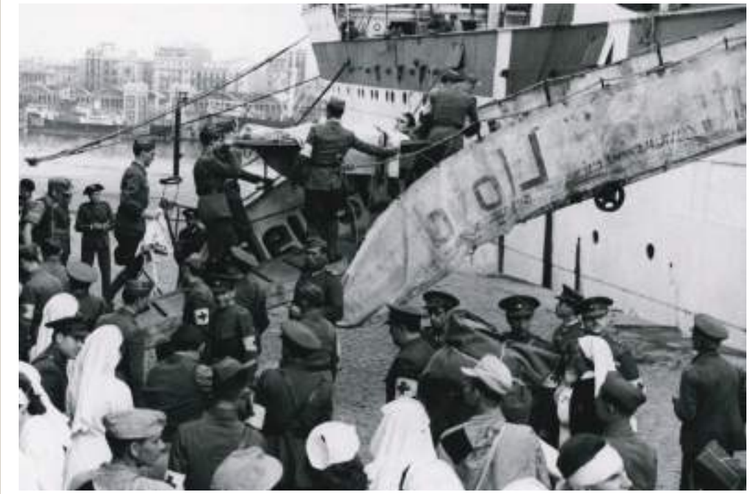
Intercanvi de presoners al port de Barcelona, 27 d'octubre de 1943.