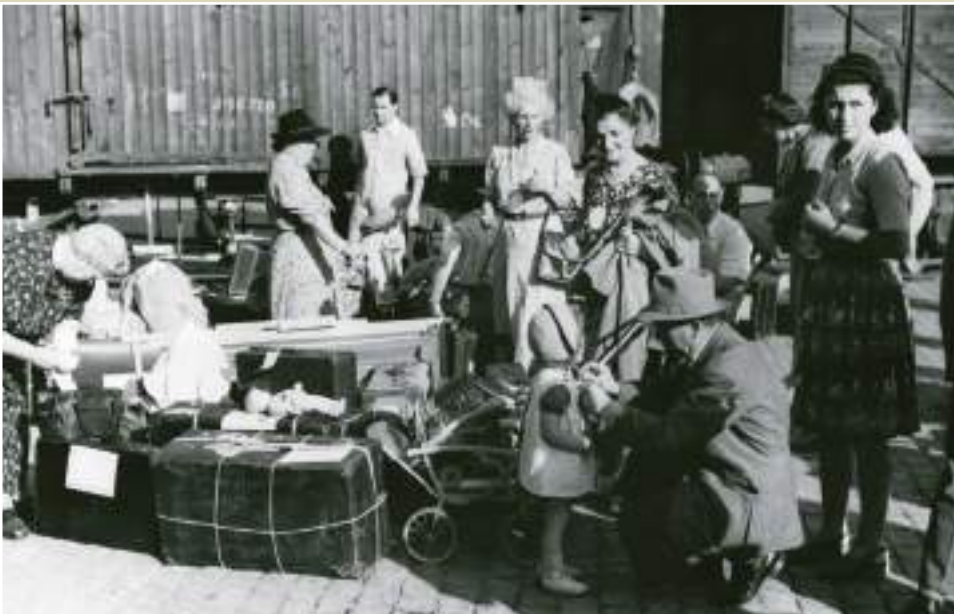
Jueus centreuropeus embarcant al vaixell Lima amb destinació a Palestina, 25 de setembre de 1945.

A la vegada, els països aliats, especialment els britànics i els nord-americans, desplegaron una xarxa d'agents a la ciutat per tal d'informar el seu govern del que succeïa en aquest important punt estratègic del sud d'Europa. També comptaven amb la col·laboració d'espanyols. El consolat britànic a Barcelona fou el punt neuràlgic des d'on es coordinava l'actuació dels agents que treballaven a Catalunya. Establiments com l'Hotel Ritz foren el lloc de residència i trobada de diplomàtics, espies, refugiats, classes benestants barcelonines i membres de la jerarquia franquista.