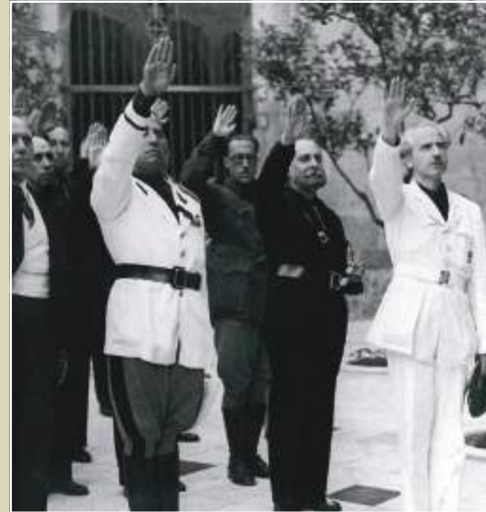
Visita del comte Galeazzo Ciano al Palau de la Diputació, 11 de juliol de 1939.