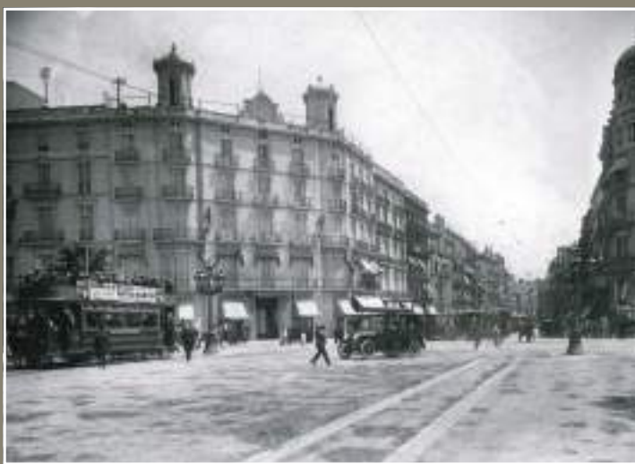
Hotel Bristol, a la plaça de Catalunya, c. 1920-1925.

■ El port, la seva proximitat amb la frontera francesa i andorrana i el fet que Catalunya fos lloc de refugi de fugitius de l'Europa en guerra atorgaren un gran protagonisme a la capital catalana. Hi conviuen membres dels serveis d'espionatge dels dos bàndols enfrontats a la Segona Guerra Mundial. La confluència ideològica del règim espanyol amb l'alemany permeté consolidar la presència de membres i col·laboradors de la Gestapo, del servei de seguretat del partit nazi o del servei d'intel·ligència militar (Abwehr). En formaven part alemanys desplaçats a la Ciutat Comtal,