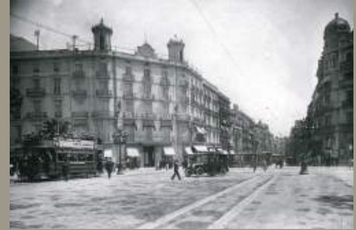
Hotel Bristol, a la plaça de Catalunya, c. 1920-1925.