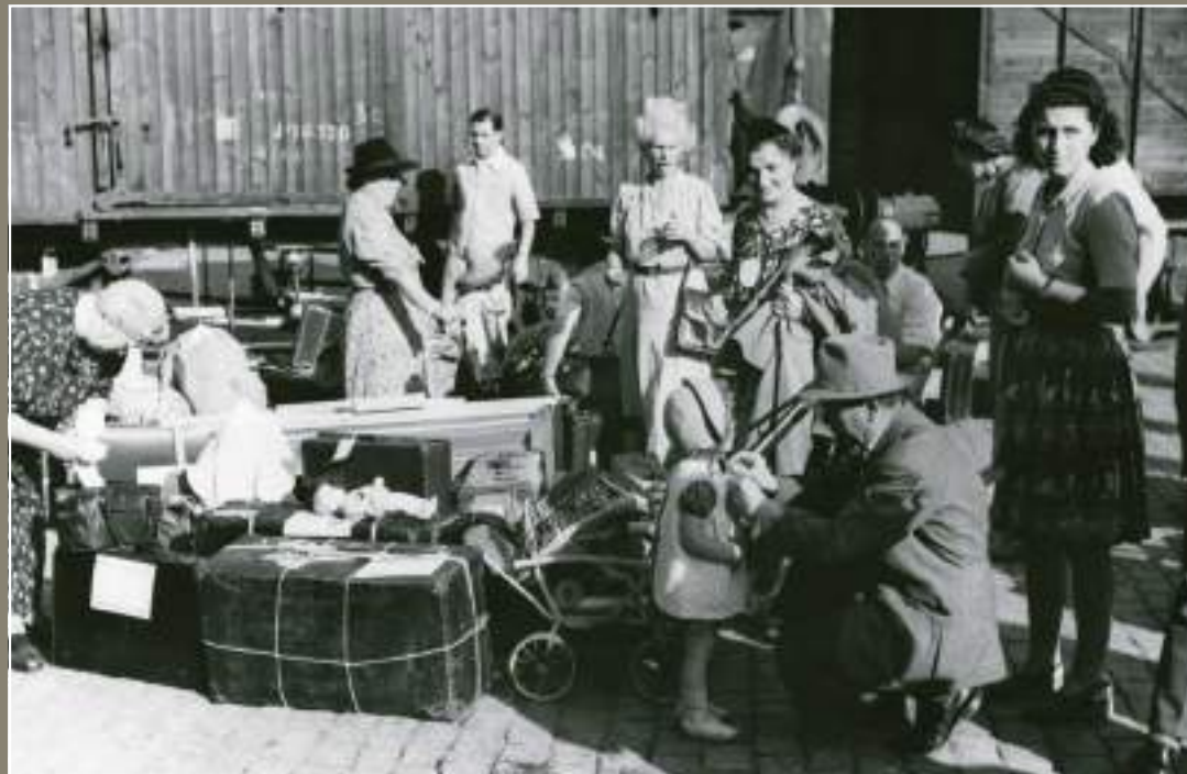
Jueus centreuropeus embarcant al vaixell 'Lima' amb destinació a Palestina, 25 de setembre de 1945.

fins i tot anys, vivint a la Ciutat Comtal, a càrrec de l'organització benèfica American Joint Distribution Committee, que des de la seva oficina, situada durant bona part d'aquells anys a l'Hotel Bristol, s'encarregava