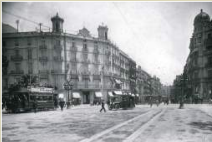
Hotel Bristol, a la plaça de Catalunya, c. 1920-1925.

El port, la seva proximitat amb la frontera francesa i andorrana i el fet que Catalunya fos lloc de refugi de fugitius de l'Europa en guerra atorgaren un gran protagonisme a la capital catalana. Hi conviuen membres dels serveis d'espionatge dels dos bàndols enfrontats a la Segona Guerra Mundial. La confluència ideològica del règim espanyol amb l'alemany permeté consolidar la presència de membres i col·laboradors de la Gestapo, del servei de seguretat del partit nazi o del servei d'intel·ligència militar (Abwehr). En formaven part alemanys desplaçats a la Ciutat Comtal, altres que hi vivien i hi desenvolupaven les seves respectives activitats laborals, més la incorporació de ciutadans espanyols que hi col·laboraven. A més, també col·laboraven amb els serveis secrets alemanys alguns policies, guàrdies civils i militars espanyols. Tot plegat va permetre als serveis d'informació nazis desplegar els seus agents amb total llibertat i controlar el que succeïa a Catalunya, tant als Pirineus com a la ciutat de Barcelona.