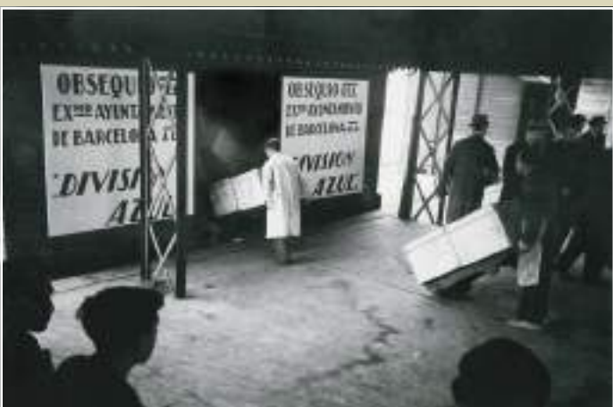
Carrega de caixes per a la División Azul a l'estació del Nord, desembre de 1941.

El llarg període que va de l'estiu de 1941 a l'hivern de 1943 va ser d'una altíssima intensitat programàtica i antiduala en el món del franquisme barceloní. Va ser en aquest ambient d'eufòria i de rewenja que l'Ajuntament de Barcelona va recordar i honorar els «seus» voluntaris de la División Azul que havien marxat, mal equipats, mal preparats i gairebé amb les mans a les butxaques, a participar en l'anihilació dels bolxevics. El 2 de desembre de 1941 les principals autoritats de la ciutat van presenciar com eren carregats els lots de productes i altres objectes als vagons d'un tren especial que sortia de l'estació del Nord. L'Ajuntament de Barcelona va enviar als divisionaris barcelonins un total de 834 caixes com a obsequi nadalenc, cadascuna de les quals contenia torrons, melmelada, olives, panses i figues, una ampolla d'anís del Mono i dues més de vi blanc i negre. El total de la tramesa va costar al consistori barceloní més de 76.000 pessetes, una quantitat gens menyspreable en aquell temps. Sense cap mena de dubte, van ser els millors moments per als voluntaris de la División Azul.