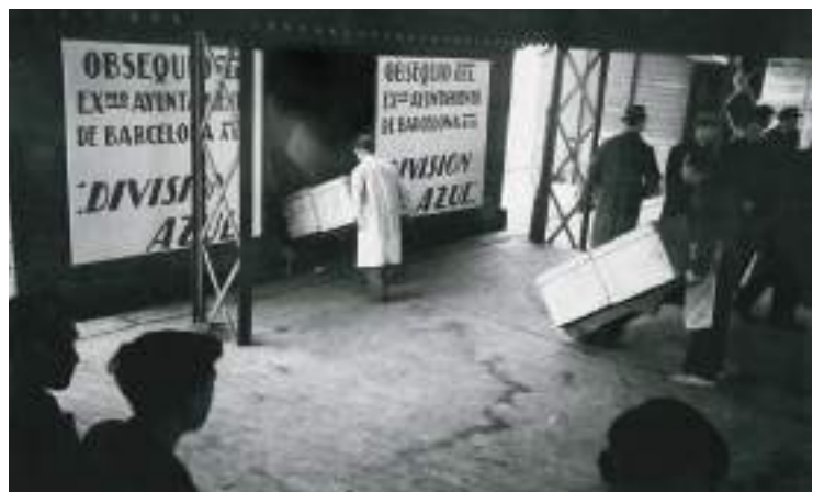
Càrrega de caixes per a la División Azul a l'estació del Nord, desembre de 1941.

eren carregats els lots de productes i altres objectes als vagons d'un tren especial que sortia de l'estació del Nord. L'Ajuntament de Barcelona va enviar als divisionaris barcelonins un total de 834 caixes com a obsequi nadalenc, cadascuna de les quals contenia torrons, melmelada, olives, panses i figues, una ampolla d'Anís del Mono i dues més de vi blanc i negre. El total de la tramesa va costar al consistori barceloní més de 76.000 pessetes, una quantitat gens menyspreable en aquell temps. Sense cap mena de dubte, van ser els millors moments per als voluntaris de la División Azul.