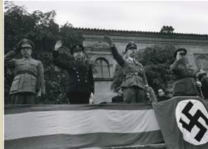
Visita de Heinrich Himmler a Barcelona, Poble Espanyol, 23 d'octubre de 1940.

A l'octubre de 1940 seria el torn del Reichsführer Heinrich Himmler, cap de les SS i de l'Oficina Central de Seguretat del Tercer Reich. Totes dues visites han deixat per a la història de Barcelona un seguit de fotografies de gran valor històric i d'enorme impacte visual. A més d'aquestes dues visites de màxim ressò internacional, Barcelona acollí també una llarga llista de visites diplomàtiques, acadèmiques, militars i d'esdeveniments socials i culturals que la van convertir en una ciutat «amiga» de feixistes italians i nazis alemanys; evidentment, amb el vistiplau i la col·laboració de les principals autoritats espanyoles i barcelonines. D'aquesta manera, Barcelona va ser redimida i va expiar els seus pecats rojos i republicans.