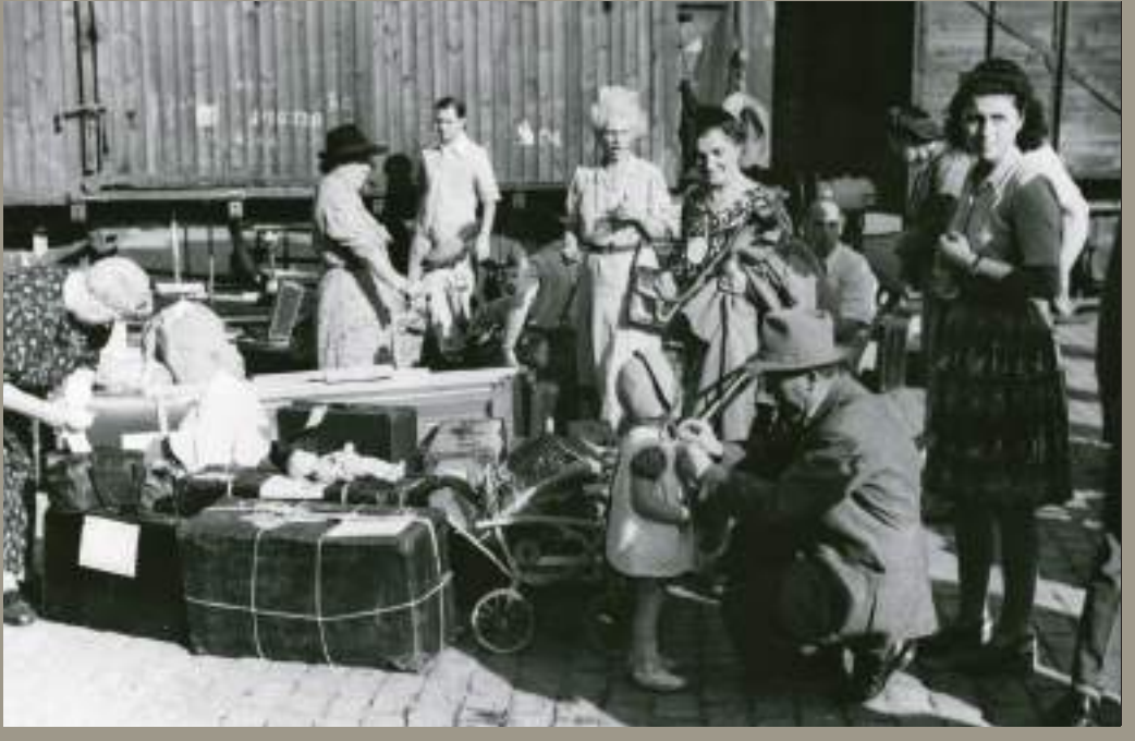
Jueus centreeuropeus embarcant al vaixell Lima amb destinació a Palestina, 25 de setembre de 1945.

El port, la seva proximitat amb la frontera francesa i andorrana i el fet que Catalunya fos lloc de refugi de fugitius de