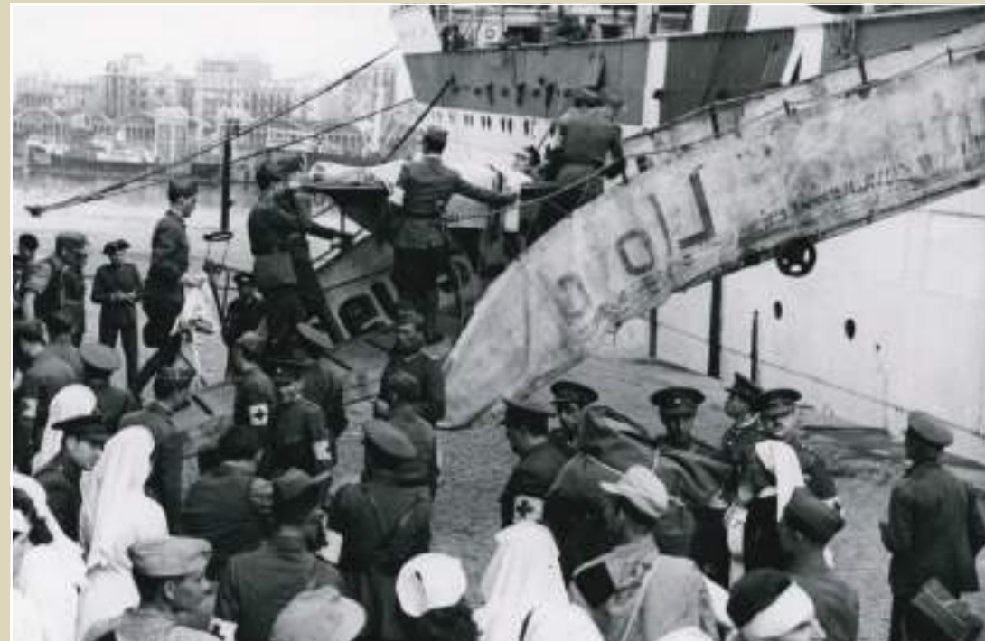
Intercanvi de presoners al port de Barcelona, 27 d'octubre de 1943.

El maig de 1944 es va viure un segon intercanvi de presoners: alemanys, britànics i nord-americans. Aquesta vegada, la cerimònia va oferir alguns canvis significatius: la presència de l'ambaixador nord-americà, l'absència dels ambaixadors alemany i britànic, la crònica de corresponals de premsa estrangers i la manca d'actes protocol·laris previs com els organitzats l'octubre de 1943. Evidentment, les autoritats franquistes no es van moure del seu discurs oficial, sobretot ara que la guerra havia fet un tomb a favor dels aliats, i l'intercanvi es va realitzar sota els paràmetres habituals i sempre tenint present que es duia a terme «gracias a nuestra neutralidad».