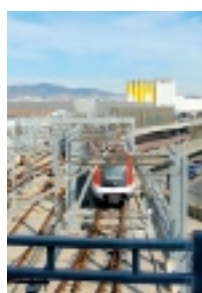
Actualmente, la Línea 9 Sur del Metro llega al Parque Logístico y a Mercabarna. La proyectada Línea 10, en el futuro, conectará la Zona Franca Litoral con el Polígono Pratense.