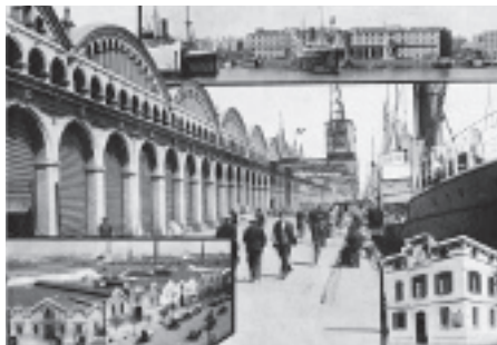
Las distintas instalaciones que el Depósito Franco de Barcelona tenía a finales de la década de 1920. Anuario del Consorcio de la Zona Franca , 1929. Archivo Histórico de la Ciudad de Barcelona