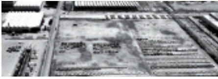
La planta de SEAT, el principal conjunto de construcciones en la Zona Franca hasta la creación del complejo de Mercabarna, en fase de ampliación, finales de la década de 1960.