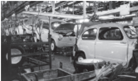
Fabricación del modelo 600 de SEAT, 1969.