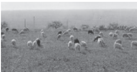
Paisaje ganadero en el delta del Llobregat, 1910-1915.

La incorporación del frente costero del delta a la conurbación metropolitana se produjo a lo largo del siglo xx , con los primeros aeródromos, el aeropuerto de El Prat, las ampliaciones del puerto, el Polígono Industrial de la Zona Franca y las grandes vías de comunicación. La dureza del impacto ambiental de estas infraestructuras ha sido objeto de un volumen notable de estudios críticos y de propuestas a favor de modalidades de empleo más sostenibles.