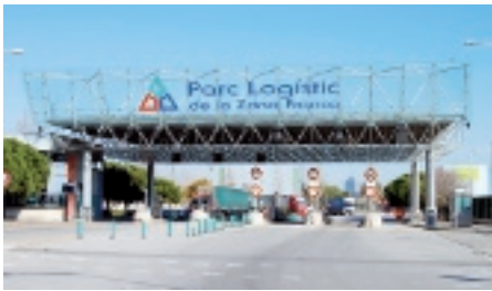
Imagen actual del acceso principal al Parque Logístico de la Zona Franca. Archivo del Consorcio de la Zona Franca

Trabajos de carga de mercancías. La logística ha ocupado algunos espacios dedicados anteriormente a la industria, década de 2000. Archivo del Consorcio de la Zona Franca