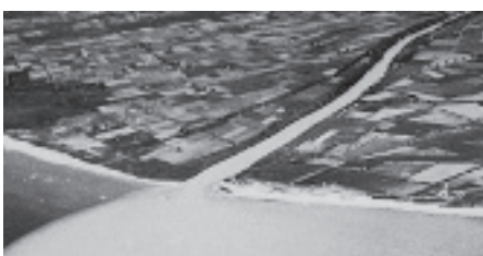
La desembocadura del Llobregat, 1929. Josep Gaspar i Serra, Instituto Cartográfico y Geológico de Cataluña