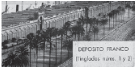
Las instalaciones del Depósito Franco con ferrocarril de mercancías, década de 1920.