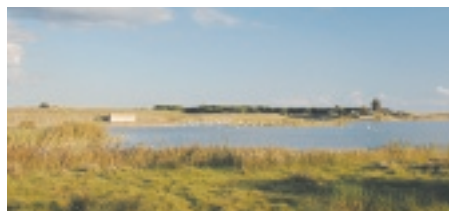
La laguna de Cal Tet, delta del Llobregat, en una imagen actual.

Por una parte, el Plan plantea la reindustrialización y el impulso de actividades económicas innovadoras y que generen puestos de trabajo inclusivos sobre el suelo industrial disponible. Por otra parte, aborda la reducción de los impactos de las industrias y de la implantación de las grandes infraestructuras de comunicación, con el objetivo de avanzar hacia la sostenibilidad ambiental y hacia una mayor urbanidad e integración de este territorio en el conjunto metropolitano, favorecida ahora también por la llegada del metro.