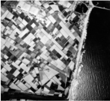
El hemidelta izquierdo del Llobregat, 1961. Vuelos históricos, Área Metropolitana de Barcelona