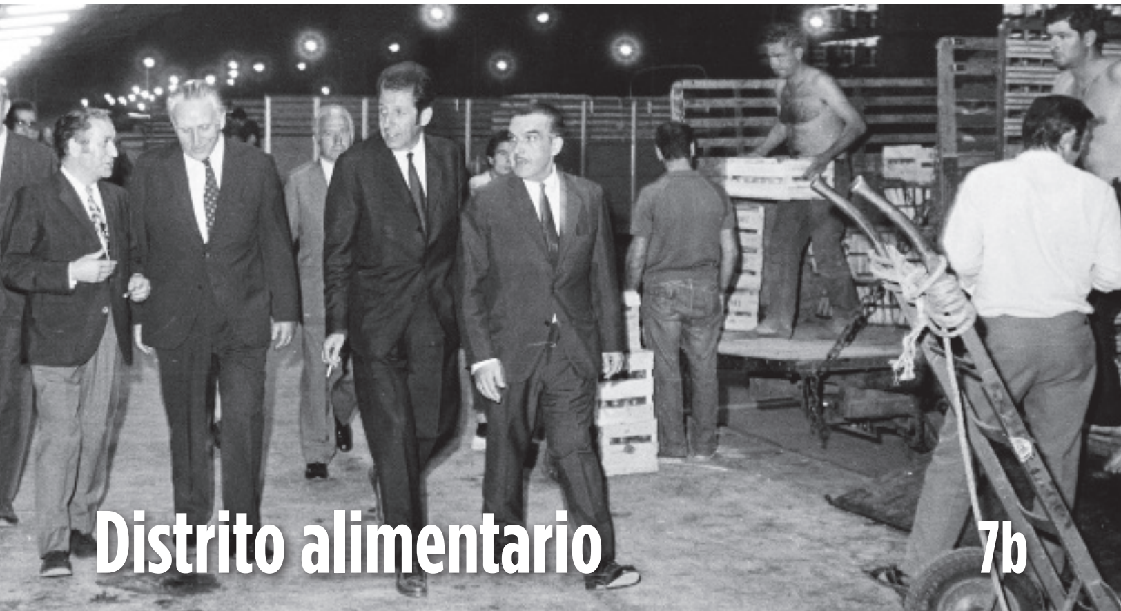
Actividad en Mercabarna el día de su inauguración oficial por el alcalde Porcioles, 1971.

Mercabarna abrió sus puertas en la Zona Franca en 1971, con el traslado del Mercado Central de Frutas y Verduras, que desde 1921 estaba en El Born. Le siguieron el Matadero en 1979, el Mercado Central del Pescado en 1973 y el Mercado Central de la Flor el año siguiente. En el recinto está también la ZAC o Zona de Actividades Complementarias, que en 2017 contaba con más de cuatrocientas empresas. En total, el complejo ocupa 90 ha, aloja a unas setecientas empresas y exporta un tercio de los productos que circulan por él.