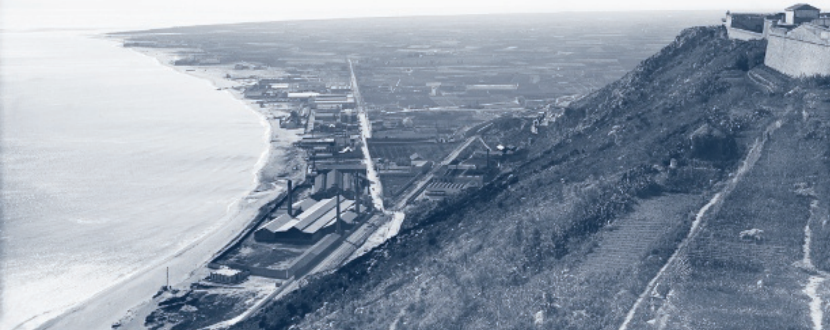
El delta del Llobregat desde el castillo de Montjuïc, 1917.

La desembocadura del Llobregat, con un delta formado en edad geológica reciente, fue un espacio de humedales, con aprovechamientos ganaderos desde la antigüedad. En el siglo xvi se empezaron a desecar zonas húmedas para extender los campos de cultivo, que en el margen izquierdo del río se pudieron regar, a partir de 1820, con el canal de la Infanta. No muy lejos se extendieron los prados de indianas y, durante el siglo xix , aparecieron también las primeras industrias en La Marina de Sants, sobre todo en El Prat Vermell. Allí se ubicaron también uno de los grupos de casas baratas para los chabolistas desalojados con motivo de la Exposición Internacional de 1929.