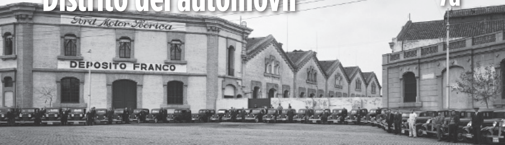
Las instalaciones de Ford Motor Ibérica en el Poble Nou, 1935.

La industria de la automoción ha sido un puntal histórico del depósito franco y de la Zona Franca. En 1923 Ford se trasladó del depósito franco de Cádiz a la avenida de Icaria de El Poble Nou, en régimen de franquicia desde 1928: en estas naves, en 1929 se montaron 6.904 turismos y 5.123 camiones. General Motors siguió el mismo camino. Instalada primero en Málaga y después en Madrid, en 1932 se trasladó a un taller con franquicia cerca de la Sagrada Familia. Ambas empresas tenían la Zona Franca en el punto de mira. En 1935 Ford se planteó construir una gran factoría, y el mismo año, General Motors planeó una planta para 20.000 vehículos anuales. Pero todo se detuvo con la guerra y la autarquía.