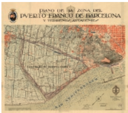
Plano de la zona prevista para la instalación del puerto franco elaborado por los topógrafos del ejército español, 1926.