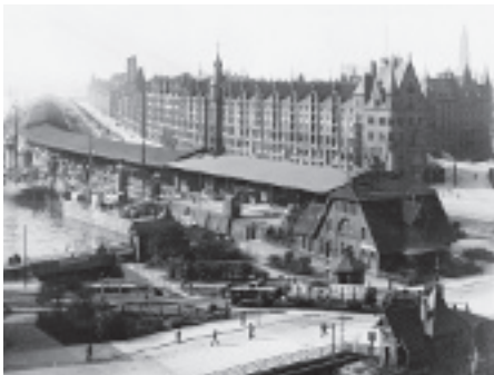
Imagen del Sandtorhafen, puerto franco de Hamburgo, década de 1910. Museum für Hamburgische Geschichte/SHMH

Viñeta de 1934 del caricaturista Ricardo García López, que firmaba con el seudónimo K-Hito, en la que aún se evidencia, en una fecha tan tardía, la pugna política en torno al puerto franco. ABC, 12 de julio de 1934. Archivo del Consorcio de la Zona Franca