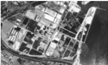
El hemidelta izquierdo del Llobregat, 1970. Vuelos históricos, Área Metropolitana de Barcelona