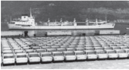
Embarque de coches de SEAT para su exportación a Yugoslavia, 1969.