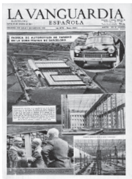
Portada de La Vanguardia , 16 de octubre de 1952.

En 1948 el INI autorizó la implantación de SEAT en Barcelona, después de muchas reticencias. La mano de obra cualificada, una industria auxiliar potente y el puerto decantaron la decisión, y la empresa se ubicó en la Zona Franca, donde podía contar con franquicia aduanera y terrenos. En 1953 abrió sus puertas. A partir de 1957 comenzó a producir el Seat 600, y en la década de 1970 superó los 25.000 trabajadores. No muy lejos se ubicaron las dos grandes factorías de vehículos pesados: Motor Ibérica en 1967, procedente de El Poble Nou, y ENASA-Pegaso en 1971, heredera de la Hispano Suiza y procedente de Sant Andreu.